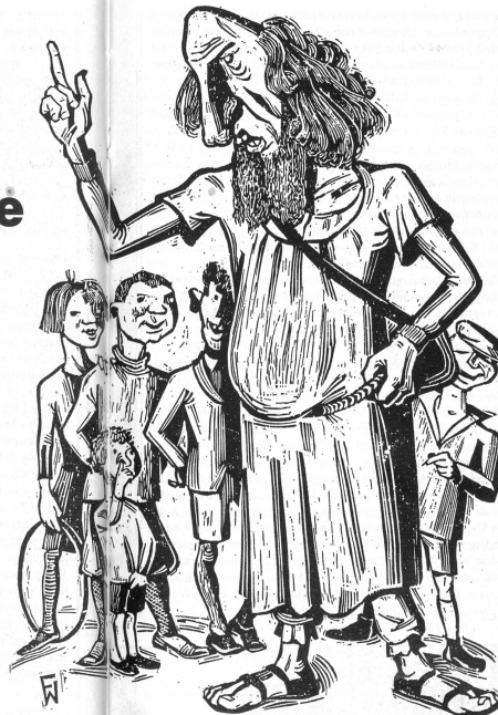
Naturapostel, Holzschnitt, aus: Junge Menschen, Jg. 8, 1927

Die Kritiker unterstellen, daß Eingriffe in die Umwelt, die Gesundheit und Leben von Menschen gefährden, »anthropozentrisch« seien. Damit verfälschen sie den Begriff, denn »anthropozentrisch« – den Menschen in den Mittelpunkt stellend – kann sich nur auf die Sonderstellung des Menschen in der Natur und damit auf die Interessen der gesamten Menschheit beziehen. Wenn individuelle