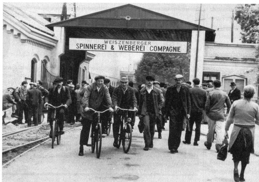
Arbeiter in Marienthal

Szenenfoto aus einem Fernsehfilm von Karin Brandauer