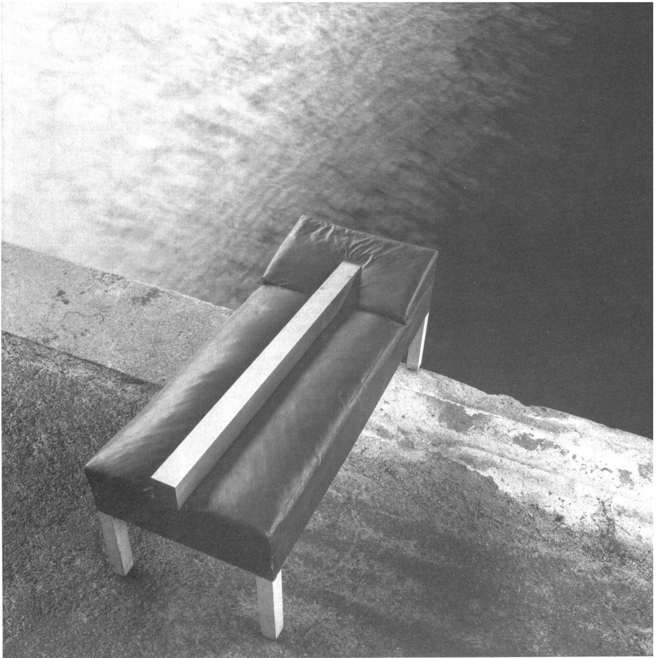
Paul Pfarr: »Hölderlin Räume« aus: Paul Pfarr, Walter Aue: Hölderlin Räume, Edition Cantz