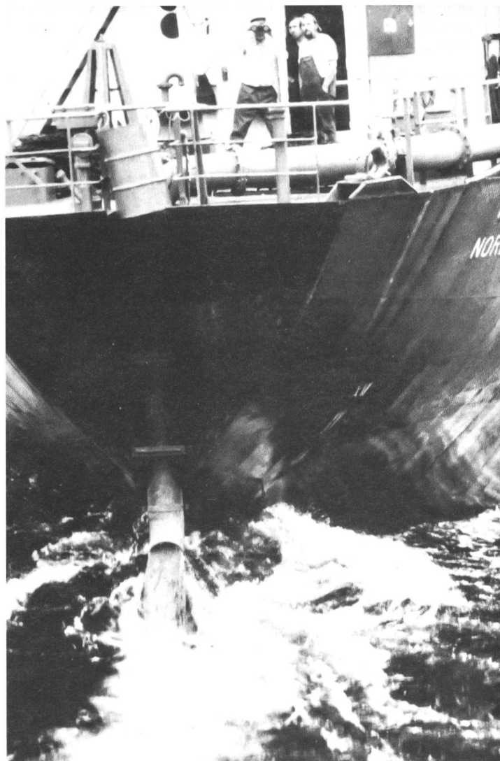
Verklappung von Titanoxid in die Nordsee

Schwermetalle hätten in der Umweltbelastung keine Bedeutung mehr, würden wir das Maß ihrer Schädlichkeit an ihrem Echo in der Presse messen. Lange haben neue »Modегifte« wie Dioxine, PCBs und Tschernobylisotope ihnen den Rang in den Spitzenmeldungen über Umweltgifte abgelaufen. Am Ende der 70er Jahre gehörten sie noch zu den am meisten genannten Umweltbelastungen, heute sind sie fast in Vergessenheit geraten. Und das zum Teil leider zu Unrecht, denn sie werden weiter in großen Mengen produziert, sie sind weiter in großen Mengen in unserer Umwelt vorhanden, sie werden weiter in die Biosphäre emittiert, und auch ihre Eigenschaften, sich anzureichern und zu akuten und schleichen den Vergiftungen zu führen, haben sie nicht verloren. Ihre Rolle für den Ökokreislauf und ihr Anteil am Gefahrenpotential für die Umwelt muß im Spannungsfeld zwischen steigender Produktion