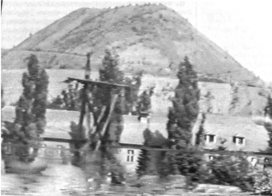
Ein Teil der Halden wurde mit einer Erdschicht bedeckt. Die dort wachsenden Pflanzen dürfen nur als Viehfutter verwendet werden. Pilze wachsen dort auffallend gut. Uranabraumhalde bei Schneeberg.

Quelle radioaktiver Umweltbelastung. Das auf den Halden verbleibende Uran mit seinen Zerfallsprodukten wird zum Teil als Staub vom Wind verweht, gelangt so auf umliegende Felder und Ortschaften und verunreinigt dort Boden und Atemluft.