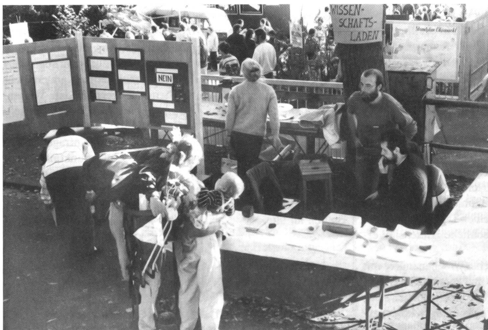
Der Wissenschaftsladen als Dienstleistungsunternehmen: Beratungsarbeit muß die abgehobene Wissenschaftssprache in allgemeinverständliche Sätze übersetzen.

Der Wissenschaftsladen als Therapie gegen Defizite im eigenen sozialen und beruflichen Umfeld ist nur bedingt tauglich. Vielfach führt die Mitarbeit zu anderen Heilungserfolgen, als sich das die PatientInnen vorher vorgestellt haben.