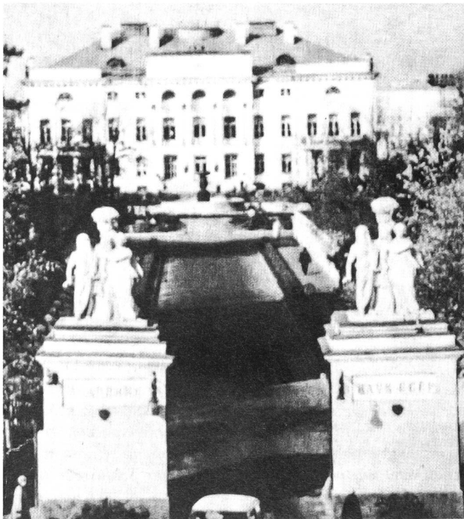
Bald nur noch ein elitärer Club? Die sowjetische Akademie der Wissenschaften in Moskau

Direktbeziehungen sollen den gesamten Zyklus von Forschung und Entwicklung, Produktion und Vertrieb umfassen. Die neuen Rechte der Unternehmen sind eine Voraussetzung dafür, daß sowjetische Forschungsinstitute und Ingenieurbüros sich ihre Kooperationspartner selbst suchen können. Daß es auf dieser Basis 1987 schon zu 700 Vertragsabschlüssen kam und die Sowjetunion sich an 50 gemeinsamen Organisationen und vier Betrieben beteiligte, zeigt die Bedeutung, die die Sowjetunion dieser Form der Zusammenarbeit beimißt.