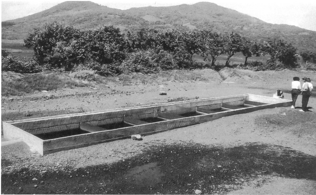
Das Filter besteht aus mehreren Kammern, von denen jede die durchschnittliche Tagesmenge an Pestizidabwässern aufnehmen kann.

Eine der Möglichkeiten, die Effektivität des Abbaus zu überprüfen, wäre der gaschromatographische Nachweis der im Filtrat verbleibenden Pestizide, also eine quantitative Erfassung der Abbaupkapazität. Neben methodischen Problemen, die sich mit solcher Bestimmungsmethode stellen, stellt sich in Nicaragua auch das Problem der fehlenden Ausstattung. In ganz Nicaragua gibt es nur zwei oder drei funktionierende Gaschromatographen.