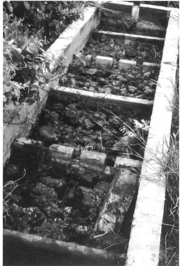
In den Filtern finden lokale Materialien wie z.B. Vulkanschlacke Verwendung. In drei bis sechs Tagen durchläuft das Abwasser die Kammer.