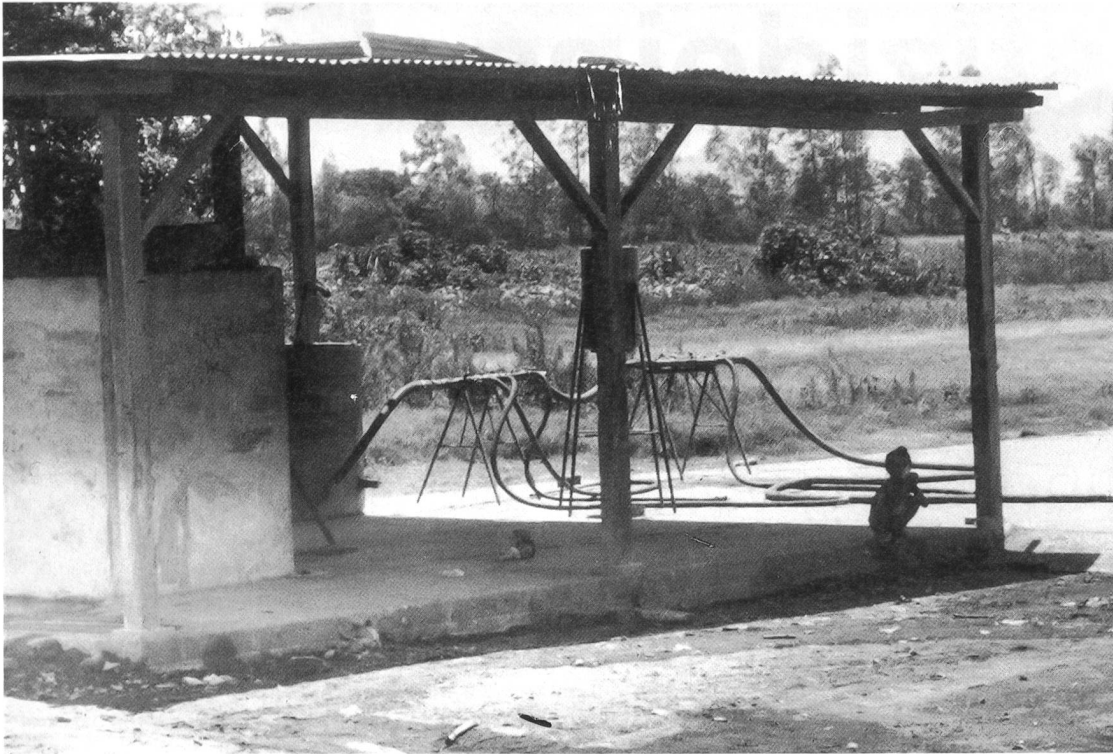
Die Misch- und Füllplätze für die Pestizide auf den landwirtschaftlichen Flugpisten sind beliebte Spielorte für Kinder.

Das Wasser für die Bewohner als auch für den Flugplatz wird aus einem gemeinsam genutzten Brunnen gezogen, der zwischen Piste und Siedlung liegt. In der Spritzperiode fliegen täglich sieben Flugzeuge, wovon jedes durchschnittlich sieben Flüge durchführt, wenn Pestizide versprüht werden, und bis zu 30 Flügen bei der Ausbringung von Harnstoff.