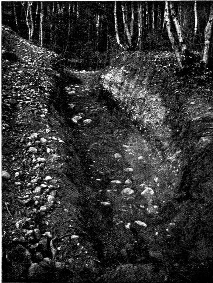
Römerstrasse bei Rohr :

Auf einem aus grossen, flach neben einander gelegten Flusskieseln bestehenden Bett, das volle 6 m Breite aufweist, erhebt sich eine Aufschüttung von mit Sand durchsetztem Kies, in der Mitte bis auf 75 cm Höhe, so dass eine verhältnismässig starke Wölbung entsteht. Dieser Strassenkörper hat eine sehr grosse Festigkeit gewonnen und konnte nur mit Mühe vom Pickel durchbrochen werden. Das Ganze ist überdeckt von einer vielleicht 50 cm starken Schicht Walderde, in der den ganzen Strassenzug entlang junge Bäume wurzeln; an der Schnittstelle sind es Buchen. Seitliche Anlagen von Abzugsgräben liessen sich nicht konstatiren; die Steine, die ausserhalb des Fundamentes von 6 m liegen, können zufällig dorthin geraten sein.