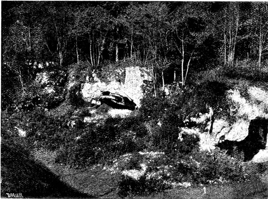
Fig. 2. Die Höhle zum Kesslerloch von Osten mit den beiden Eingängen und dem Schuttkegel vor dem südöstlichen Eingang.

Was nun die Tierwelt des Kesslerloches anbetrifft, so hoffte ich bei den neuen Ausgrabungen daselbst in gewissen noch intakten Partien von oben