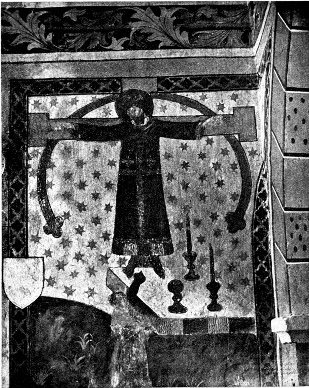
Fig. 34. Wandgemälde in Stein a./Rh. mit Darstellung des Volto santo.

Regenbogen überspannt. Vor ihr steht ein Altartisch mit Kelch und zwei Leuchtern. 1) (Fig. 34.)