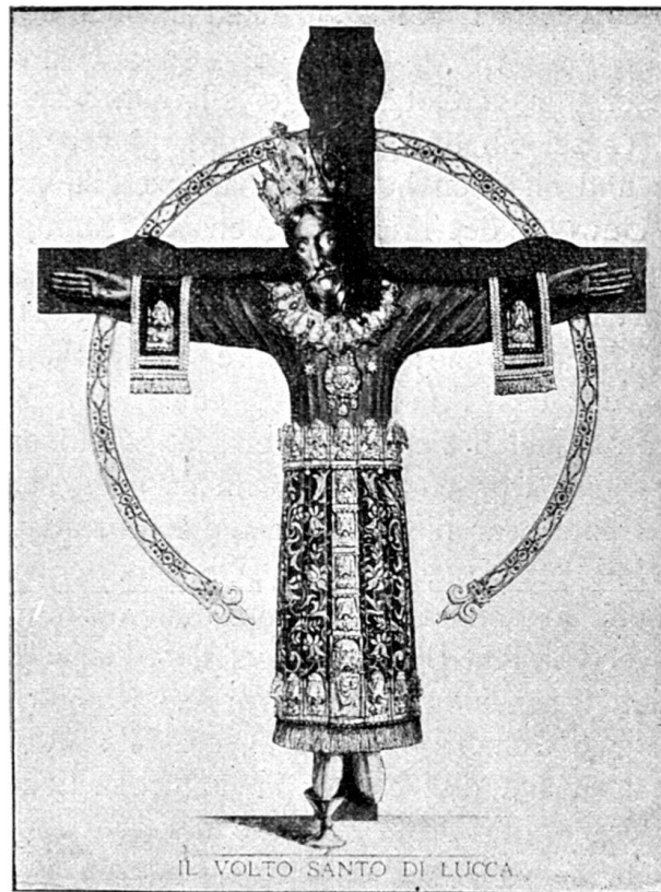
Fig. 33. Der Volto santo in Lucca.

(1845) sagt: „Noch gegenwärtig spricht der nellenburgische Bauer mit Respekt von ihm.“ In Süddeutschland besonders in Schwaben, soll man noch heute, wenn man etwas als recht gross bezeichnen will, den Vergleich brauchen „Grösser als der gross' Gott von Schaffhausen“. Man schwur bei ihm „Beim grossen Gott von Schaffhausen“, oder „So mir der gross' Gott zu Schaffhausen“. Es muss darum mit diesem, einige Dezennien vor dem Glaubenswechsel aufgerichteten und so hochverehrten Bild eine besondere Bewandnis gehabt haben. Woher die grosse Verehrung? Ein scheinbarer Zufall hat mich auf die Spur geführt.