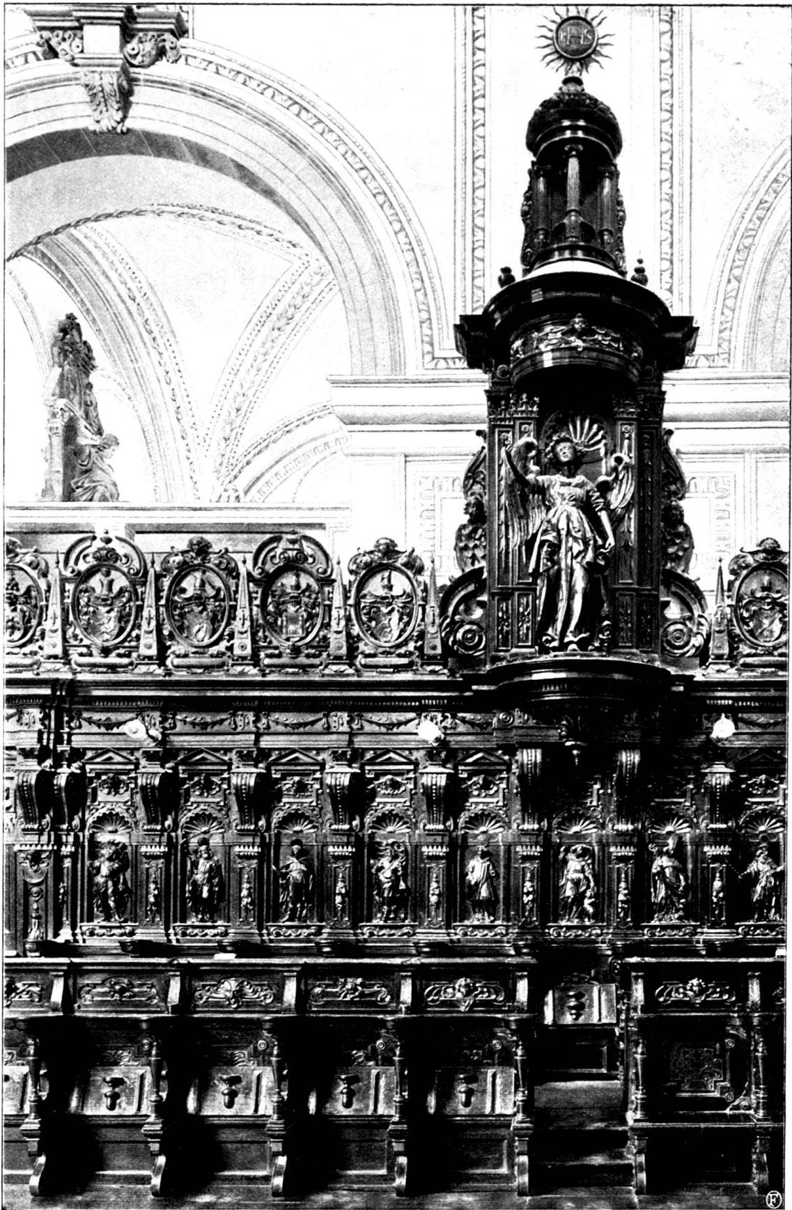
Teil des Chorgestühls der Hofkirche in Luzern.