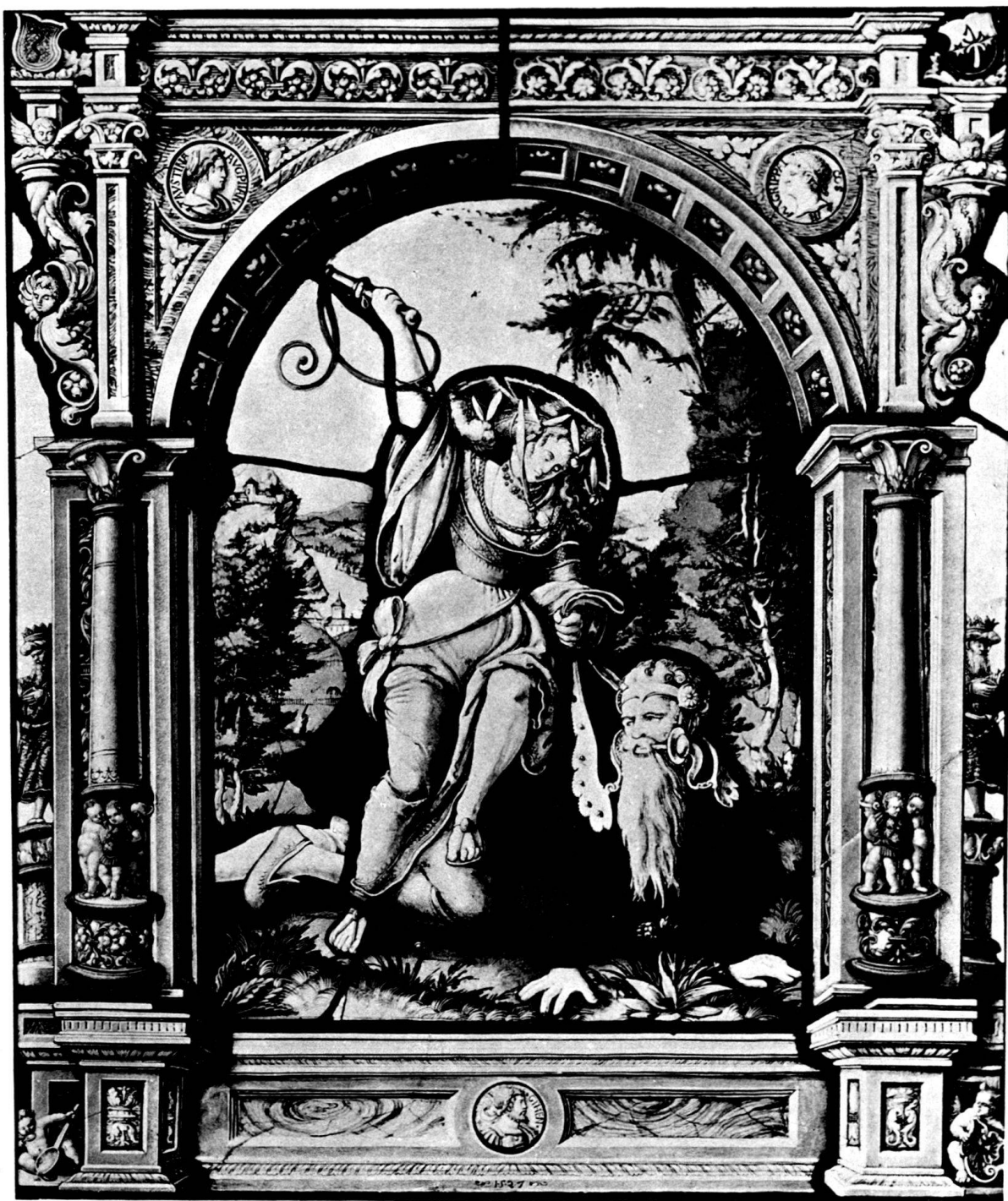
Glasgemälde von 1527 mit Darstellung des Aristoteles und der Phyllis.