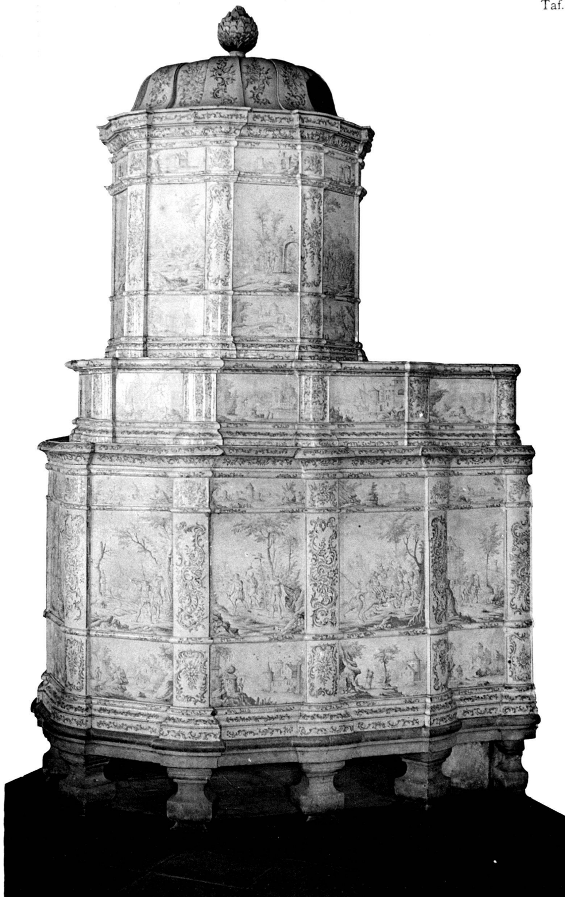
Bemalter Ofen von Michael Leontius Kuchler zu Muri.