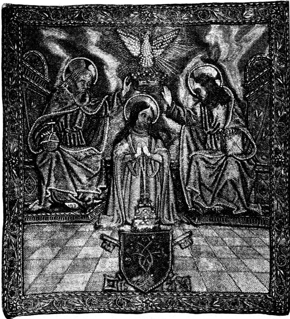
Fig. 122. Italiänische Stickerei von 1512

Die Stadtbibliothek Zürich bewahrte vier Exemplare dieser Stickereien. Zwei derselben sind mit dem Wappen des Papstes Giulio delle Rovere und der Jahreszahl 1512 versehen, (Fig. 122) offenbar die von Julius selbst geschenkten, beidseitig am Panner zu befestigenden Stücke. Die beiden andern zeigen