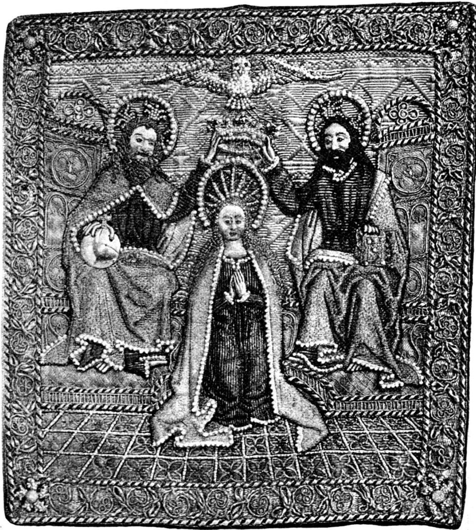
Fig. 123. Zürcherische Stickerei von 1513.

Das Vorbild ist ganz in Gold-, Silber- und (an den Fleischteilen und am Boden) in Seidenstickerei ausgeführt, mit feinem ächten Perlenbesatz, die Gewänder mit leicht durchschimmernder roter, grüner oder blauer Schattierung. Die Figuren sind selbständig gearbeitet und dem Grunde aufgesetzt. Die Gesichter sind ausdrucksvoll, alles ist mit grossem Verständnis durchgeführt.