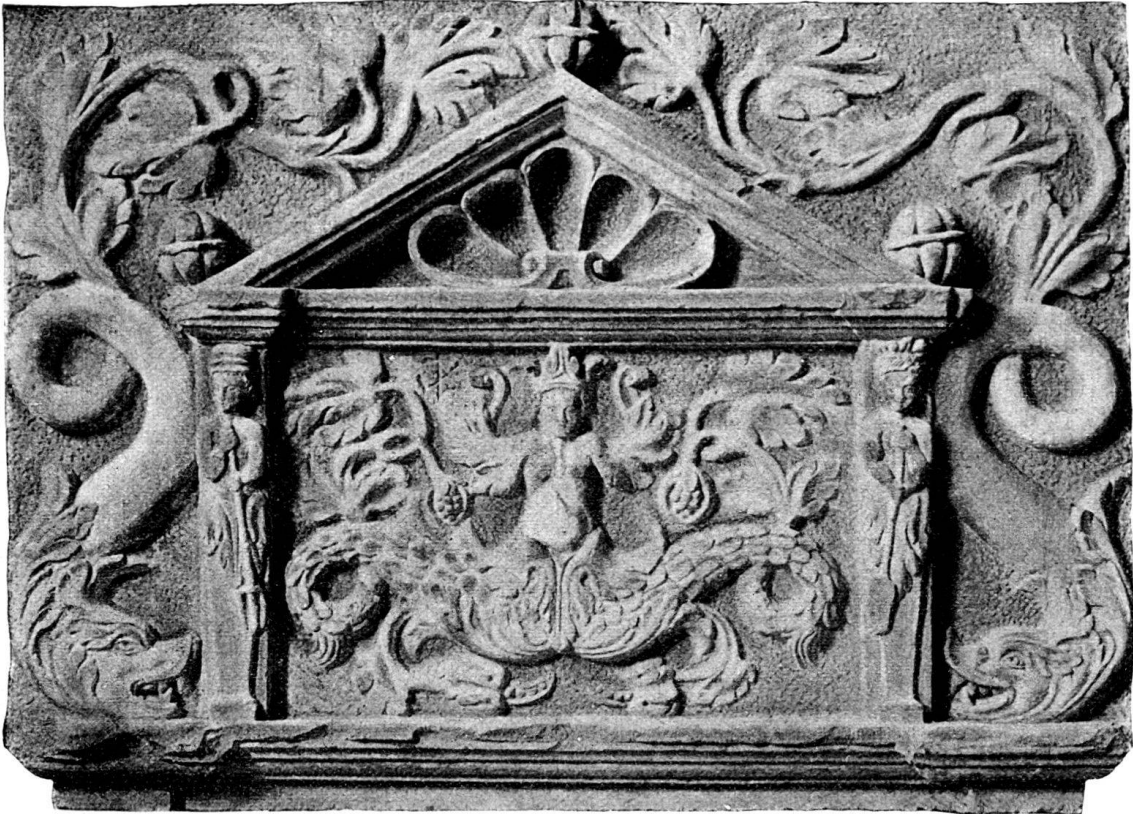
Fig. 124. Steinrelief im Museum zu St. Gallen.