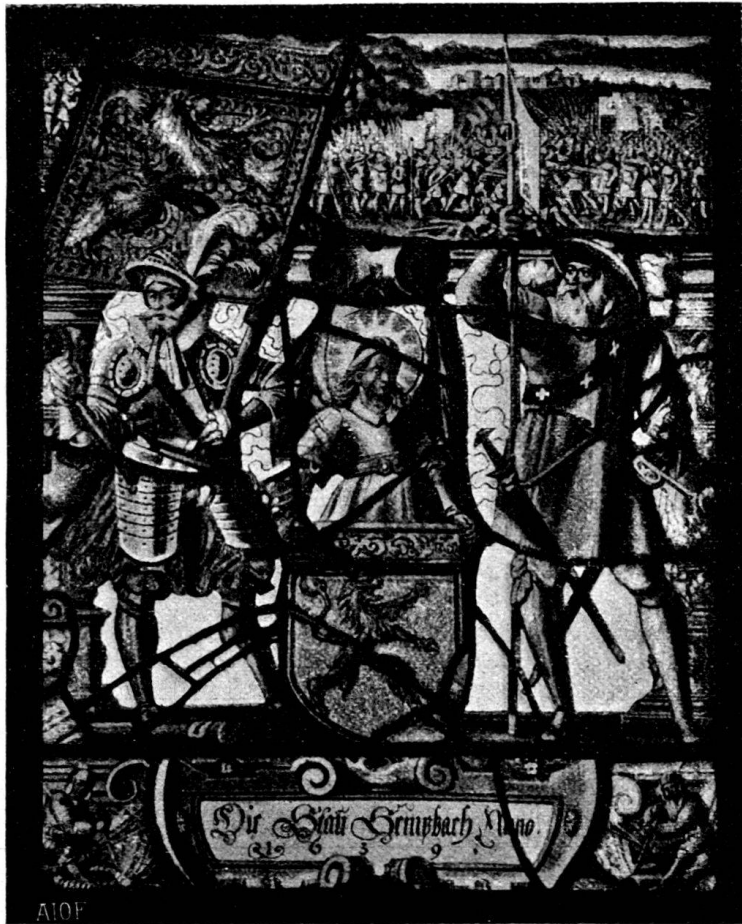
Fig. 128. Stadtscheibe von Sempach.