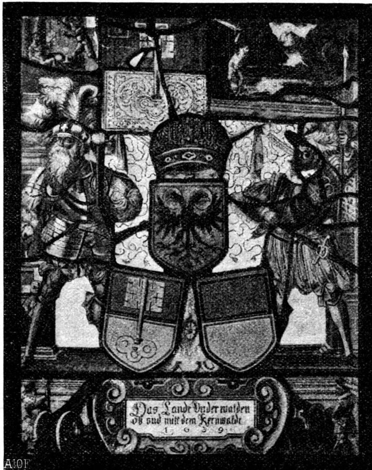
Fig. 130: Standesscheibe von Unterwalden.