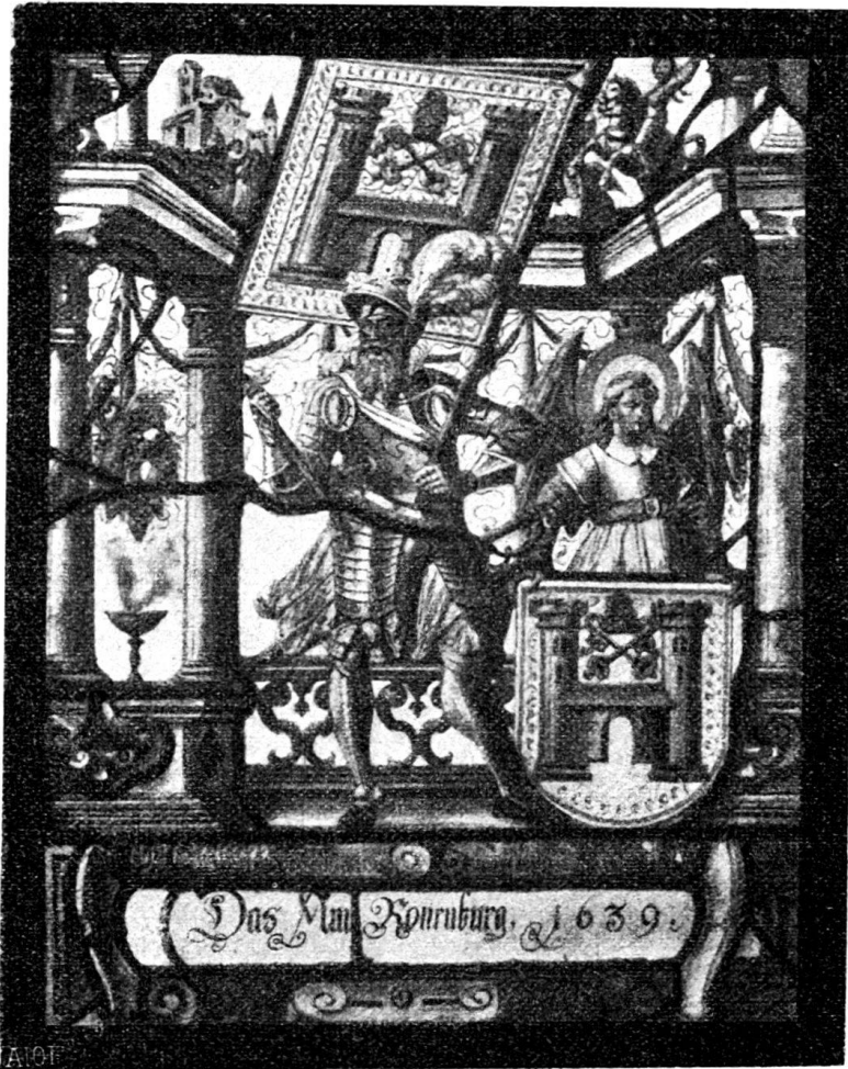
Fig. 127. Amtsscheibe von Rothenburg.

Zwischen dem geharnischten Pannerträger, der mit Streitkolben, Schwert mit Säbelgriff und Schweizerdolch bewaffnet ist, und einem Hellebardier in Panzerhemd und Ban-