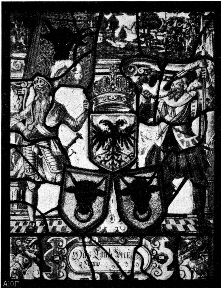
Fig. 129. Standesscheibe von Uri.

Zwischen zwei Geharnischten, wovon der rechts das Panner trägt, der Reichsschild