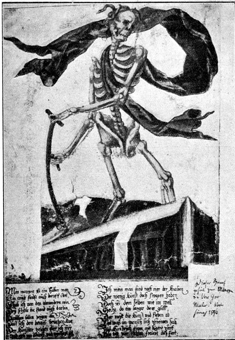
Fig. 150. Rückseite des Fig. 149 abgebildeten Blattes.

Jakob Graff , der letztgeborene Sprössling des alten Hug, war ein Raufbold und Lump erster Güte, aber als solcher auch die dankbarste Persönlichkeit, die aus dem Aktenstaube ausgegraben werden konnte. Er spielte den Urs, nur fehlte ihm das Genie!