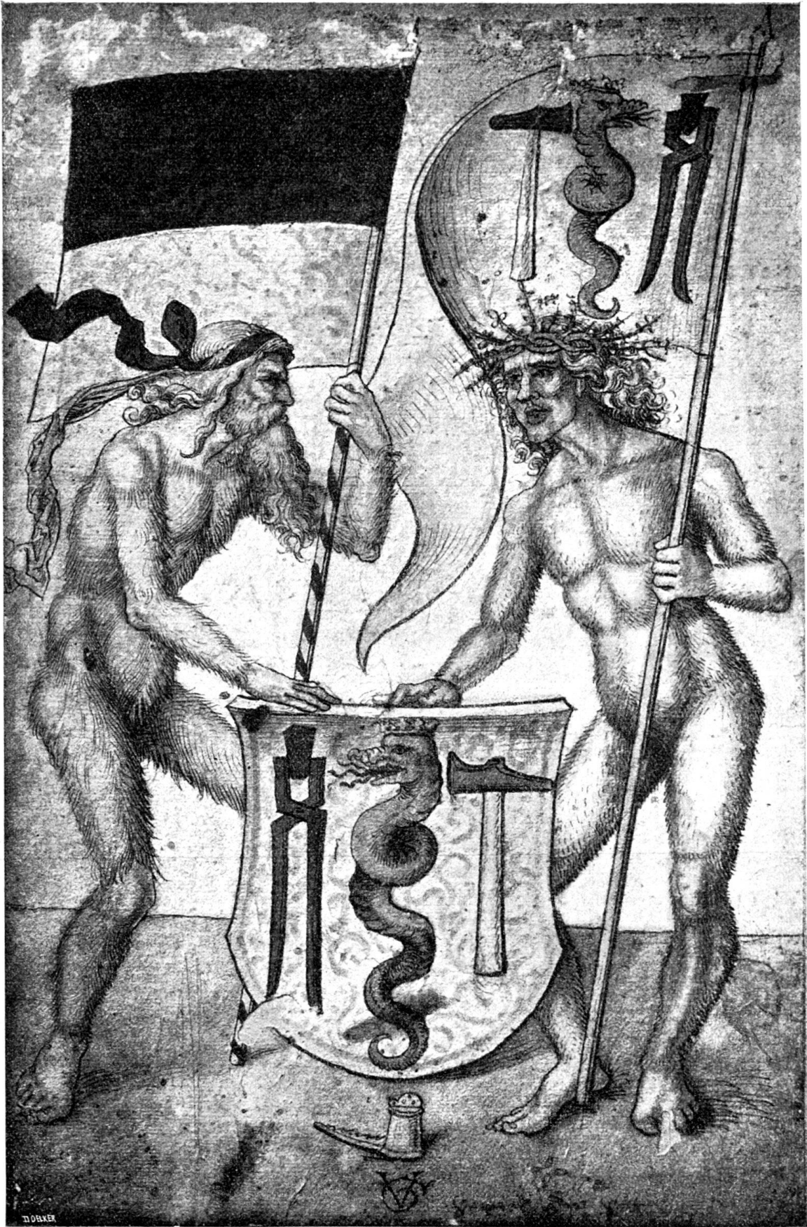
Fig. 148. Titelblatt des Zunft-Protokolles der Schmiede zu Solothurn von Urs Graff.