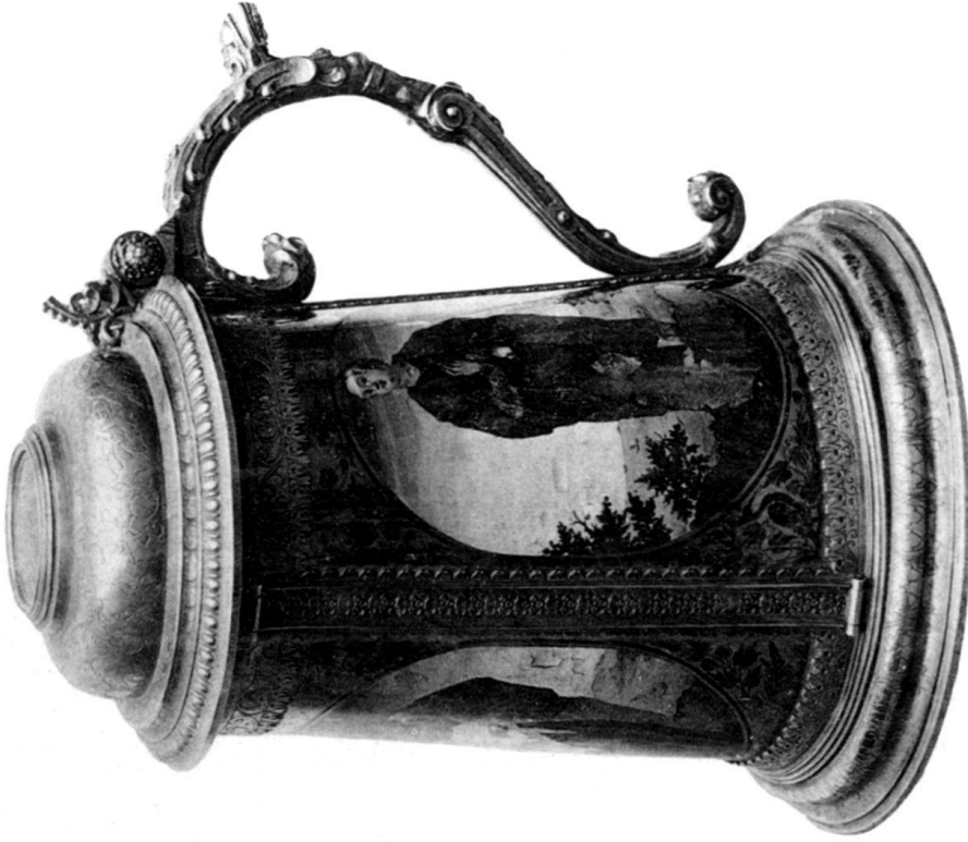
Nr. 1 (in Nürnberg).