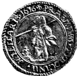
Fig. 65. Nr. 736.