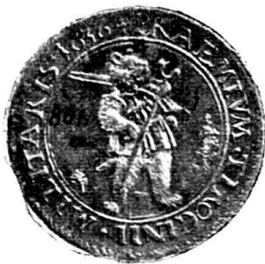
Fig. 64. Nr. 735.

Diese zwei damals geprägten Pfennige erkennen wir in den Nrn. 735 und 736 des bernischen Münzkabinetts wieder (Fig. 64 u. 65). Beide Stücke sind von Silber und haben drei cm Durchmesser. Gemeinsam ist beiden die Umschrift auf dem Avers und der ganze Revers. Jene lautet: PRAEMIVM . TIROCINII . MILITARIS . 1636. Der Revers zeigt im innern Kreis von einem Lorbeerkranz umgeben die Worte VIRTVS ETHONOS,