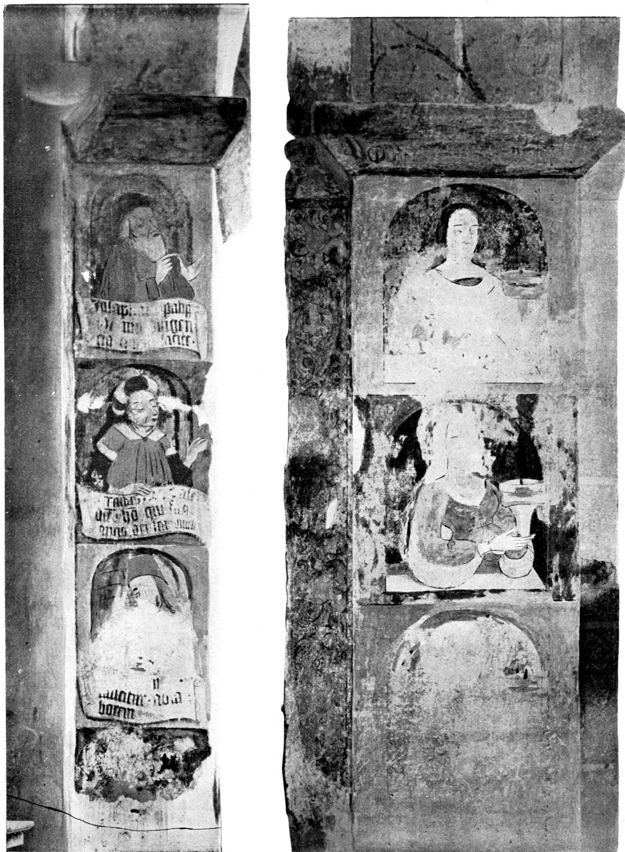
Wandgemälde am Chorbogen der Klosterkirche von Rütli.