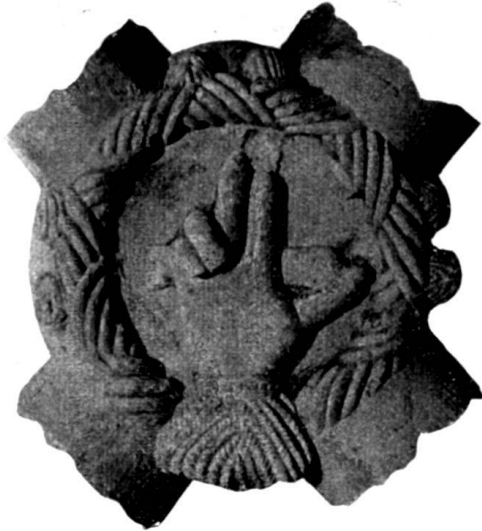
Fig. 82. Klosterkirche von Rüti, Schlußstein des Chorgewölbes.