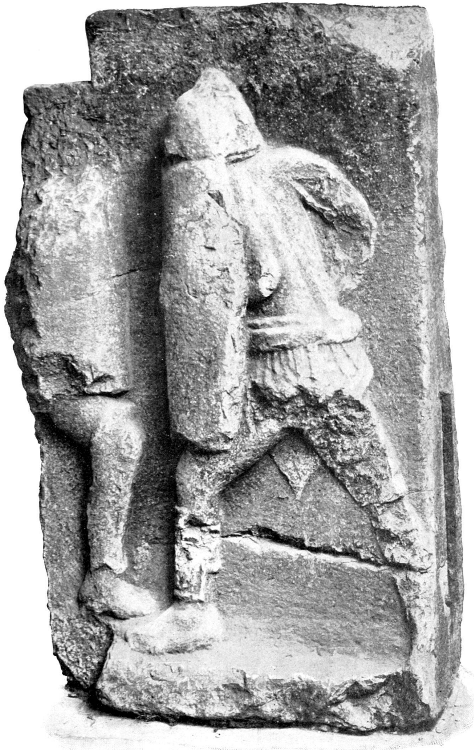
Fragment d'un haut-relief représentant deux gladiateurs.