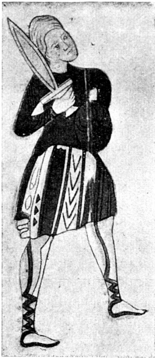
Fig. 2 (nach Hefner-Alteneck).

in peinlich exakter Weise eingeklebt und von Kellers Hand kommentiert worden sind.