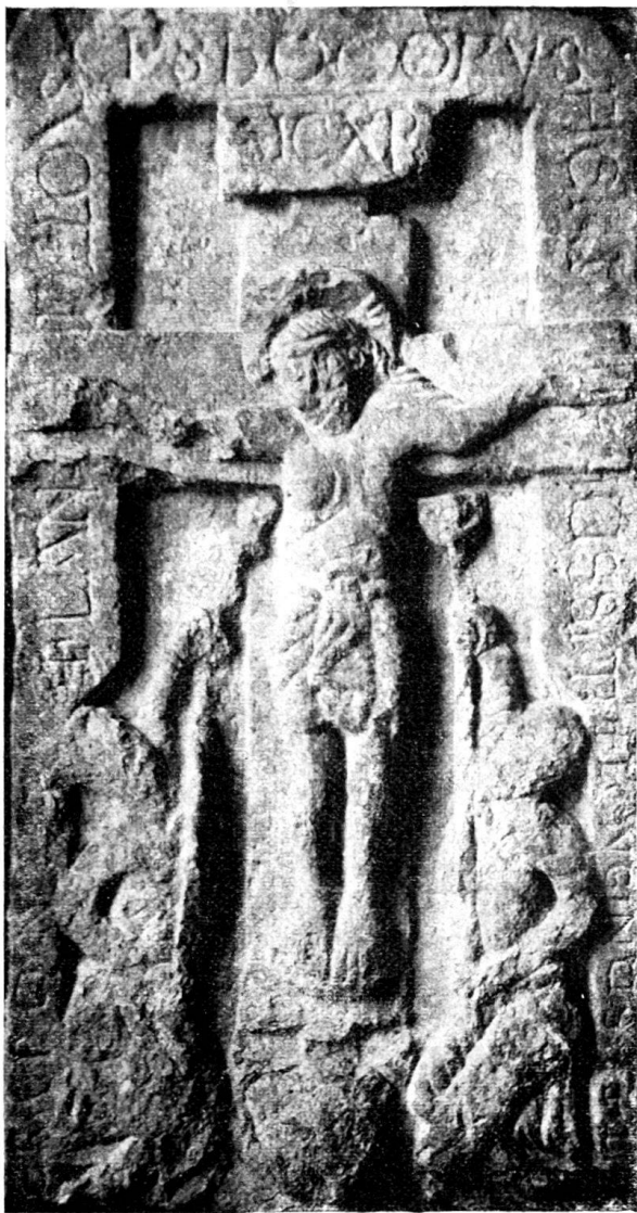
Fig. 65. Romanisches Relief aus Herznach.

Aarau. Kantonales Antiquarium. Neue Erwerbungen. Steinerne Relieftafel (Fig. 65), gefunden bei Umbauten in der Mauer der Verenakapelle zu Herznach, aus der auch der spätgotische Altar (Anzeiger N. F., V, S. 290) stammt. Höhe 95 cm, Breite 50 cm, Dicke 17 cm. Gelblicher Kalkstein, nach der Aussage von Prof. Mühlberg nicht schweizerischer