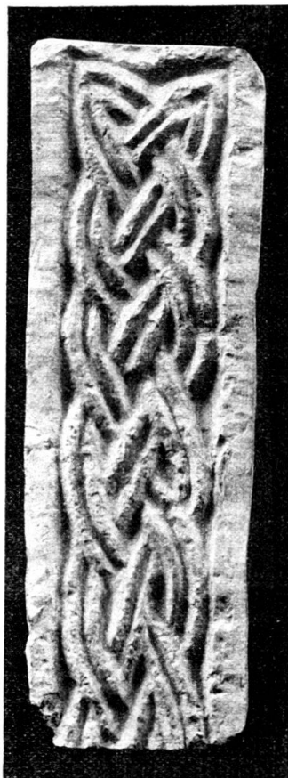
Fig. 66. Bandornament vom Relief aus Herznach.

Lanze. Umschrift: LANDELOVS III PS (= episcopus) HOC OPVS FIERI IUSSIT †. Neben der Figur mit dem Schwamm, am Rande: LONGINVS †; neben der andern Figur: ERATON †. Am Kreuz Täfelchen mit den Buchstaben IIIIC XP, also = IHC (ovs) XP (ιστος). — Nach Mitteilung von Herr Dr. Merz findet sich ein Bischof Landelous von Basel in einer Urkunde vom Jahr 961.