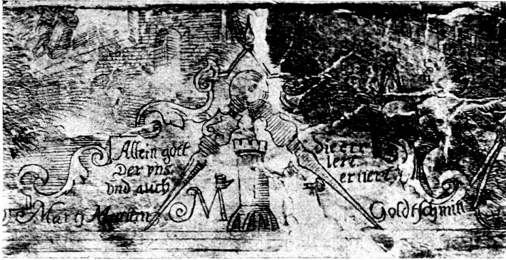
Fig. 30. Monogramm auf dem kleineren Plane der Stadt Freiburg, 1608. (Originalgröße.)

Vorzeichnungen dazu von fremder Hand empfangen habe. Das letztere ist wahrscheinlicher, weil seine übrigen Arbeiten mit wenigen Ausnahmen entweder nur Einzelfiguren, Heilige und Bildnisse von Zeitgenossen darstellen, oder heraldische Schildereien, Prospekte und Veduten sind. Hier, in Episoden der Murtenschlacht, der Mönchsprozession und den Chören der Andächtigen im Einsiedler Münster, hat Martini auch im Figürlichen sein Bestes geleistet. Diese Blätter