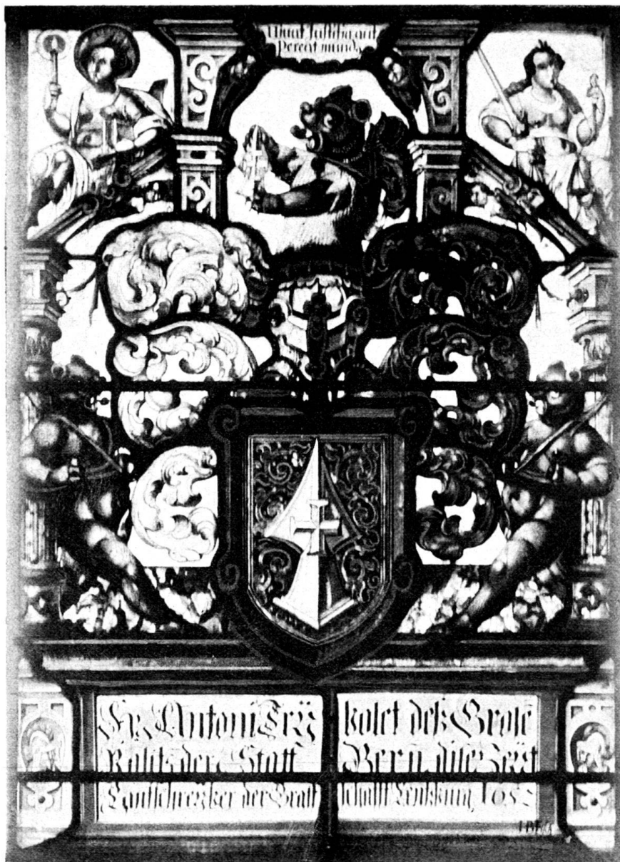
Fig. 137. Wappenscheibe des Anton Trybolet in der Kirche zu Auenstein. Von H. Balthasar Fisch in Aarau.

Die beiden im südöstlichen Fenster des Chores eingesetzten Wappenschilde gehören dem Brugger Bürger und bernischen Staatsmann Thüring Fricker 1)