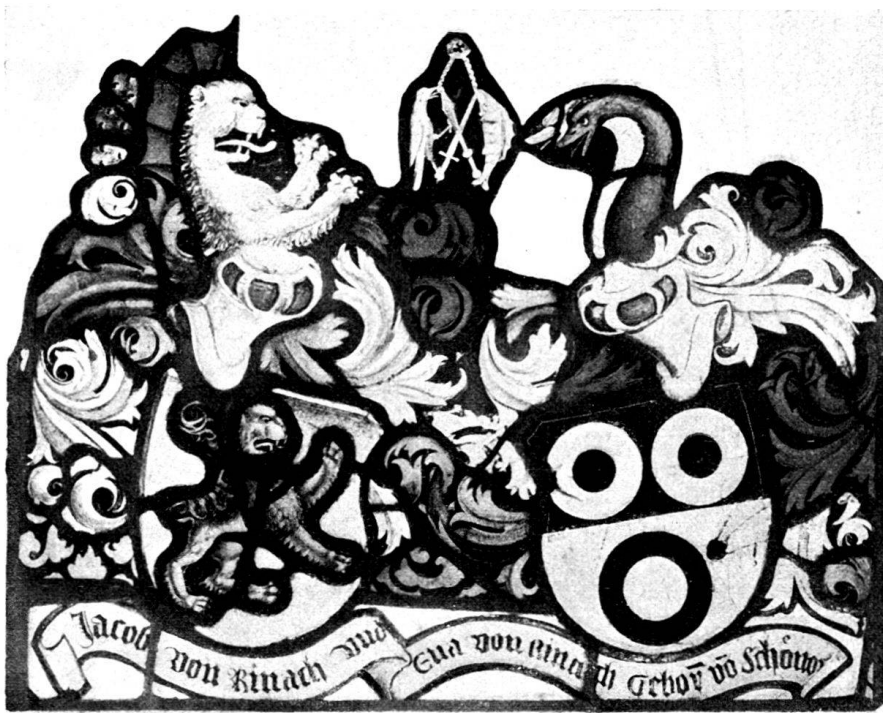
Fig. 134. Wappenscheibe von Rinach- von Schönau in der Kirche zu Auenstein.

Die andern Wappenschilder aus der Familie von Rinach sind Angebinde der Anhänglichkeit eines scheidenden Edelgeschlechtes an die Ruhestätte seiner