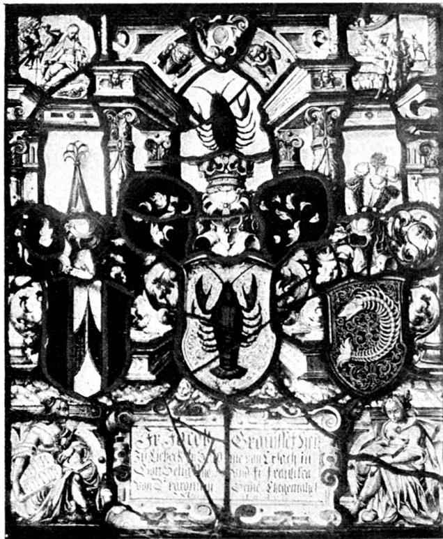
Fig. 138. Wappenscheibe Graviset- von Erlach- von Praroman in der Kirche zu Birrwil. Von H. Balthasar Fisch in Aarau. Vgl. S. 54.

Monogramm des Hans Balthasar Fisch in Aarau.