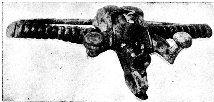
Fig. 167 Bronzefibel aus Pianezzo (Grab 282). Schweiz. Landesmuseum.

neben lagen zwei sehr große La Tène-Fibeln mit Einlagen im Bügel und Stierköpfen mit Kugelhörnern am Fuß der Fibeln (Fig. 167). In Grab 74 fand sich eine ähnliche Fibula mit einer Spät-La Tène-Fibel nebst einem Tongefäß, das auf der Drehscheibe erstellt worden war.