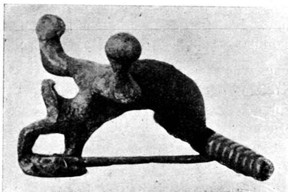
Fig. 166. Bronzefibel aus Giubiasco (Grab 465). Schweiz. Landesmuseum.

Henkelgefäß aus Bronze, das als Verzierung über dem Henkelansatz einen Stierkopf mit Kugelhörnern aufweist (Fig. 165). Das Grab 465 enthielt zwei Bronzefibeln mit Bügel-Einlagen und großen Spiralen, welche am Fuß je einen Stierkopf mit Kugelhörnern besitzen (Fig. 166). Dabei lagen sogen. Misoerfibeln und späte Mittel-La Tène-Fibeln. Grab 282 von Pianezzo barg Golasecca- und späte La Tène-Fibeln. Da-