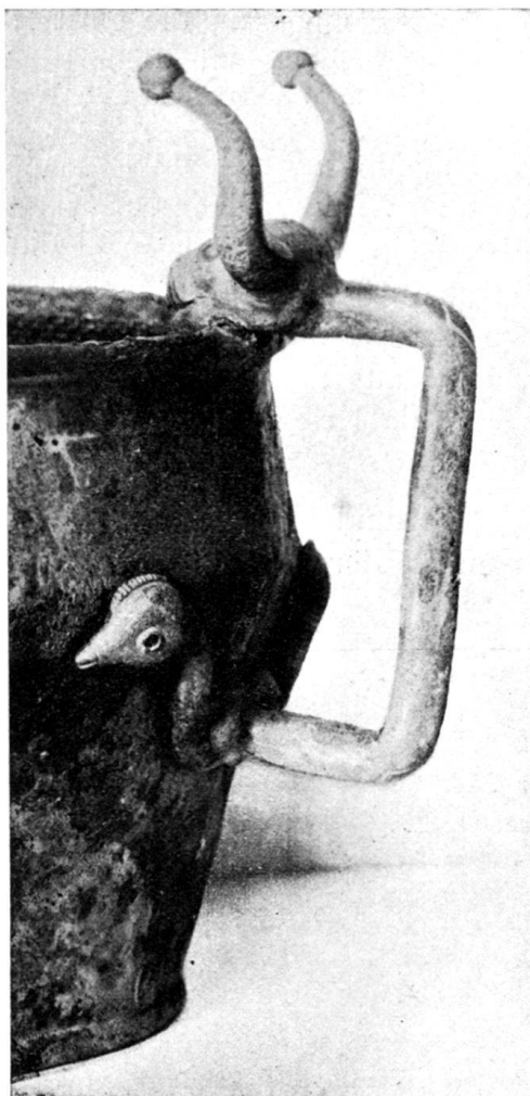
Fig. 165. Henkel eines Bronzegefäßes aus Giubiasco (Grab 262). Schweiz. Landesmuseum.

Ein anderer Fundort von Stierköpfen mit Kugelhörnern ist das La Tène-Gräberfeld von Giubiasco im Kanton Tessin. Im Grabe 262 fand sich ein