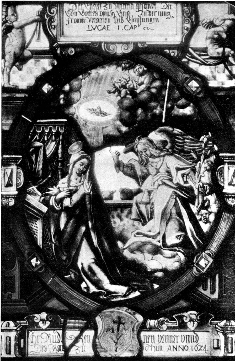
Fig. 192. Museum von Dijon. Collection Trimolet. Nr. 1245.

Oben: Der Engel zu Maria gesandt. Der Son Gottes vom h. Geist In der iung- frouwē Marien leib Empfangen.