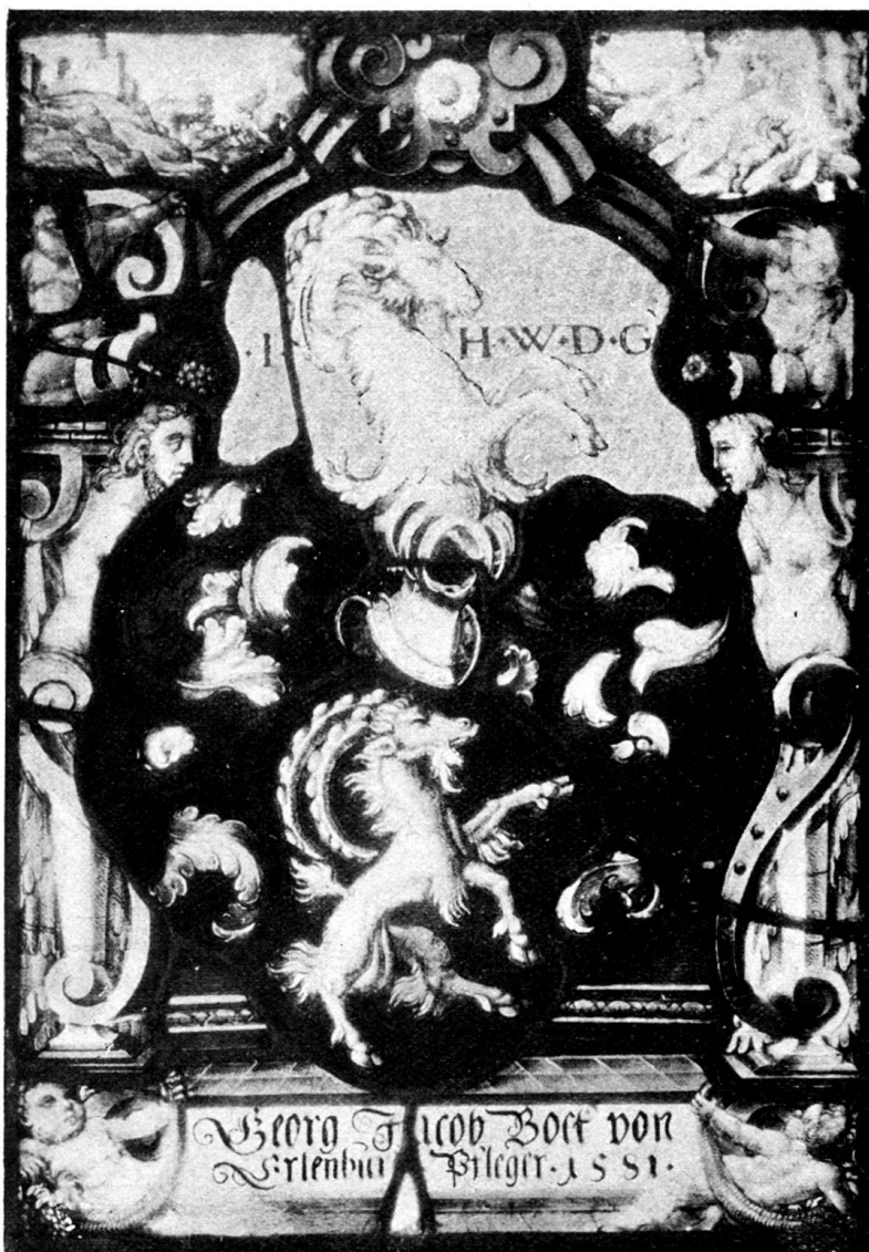
Fig. 189. Museum von Dijon. Collection Trimolet. Nr. 1241.

Wappen: Auf rotem Schild (größte Achsen 9 und 9 cm) ein silberner Bock nach links gewandt, mit roter Zunge. Helm Stahl, \frac{2}{3} von rechts,