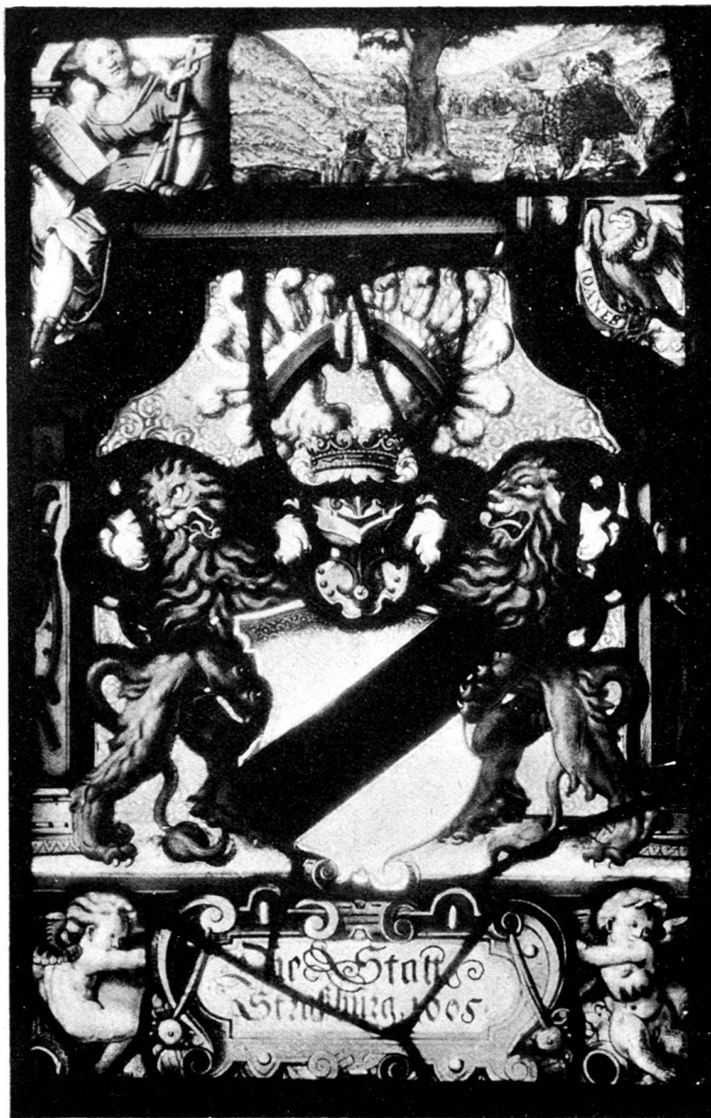
Fig. 190. Museum von Dijon. Collection Trimolet. Nr. 1242.

gewendet und die Zunge ohne besondere Tinktur. Nach maßgebenden Quellen gehört das Geschlecht der „Bocken“ zu den ältesten von Straßburg; es benennt sich nach Erlenburg, seit dieses Schloß (Unterelsaß, Kreis Molsheim, Gde. Romansweiler, heute verschwunden) im 15. Jahrhundert von Konrad Bock erworben wurde.