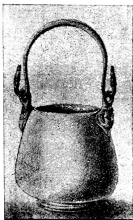
Fig. 195. Vase en bronze doré trouvé à Avenches \frac{1}{3} gr. nat. Dessin de M. Bourquin.

Dans le courant de novembre notre Musée a fait l'acquisition d'un objet très curieux qui est unique en Suisse; d'après Monsieur le professeur Blümner à Zurich, spécialiste pour les objets industriels à qui j'en ai envoyé un dessin, il n'en existerait que deux, un découvert à Troie, à poignée droite, mentionné par Schliemann et un second de l'époque romaine qui figure dans le Musée de Saalbourg. Celui que nous avons le privilège de posséder est