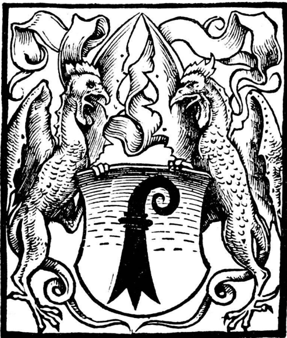
36. Urs Graf, Nr. 328 (1509); br. 0,0686; h. 0,0787.