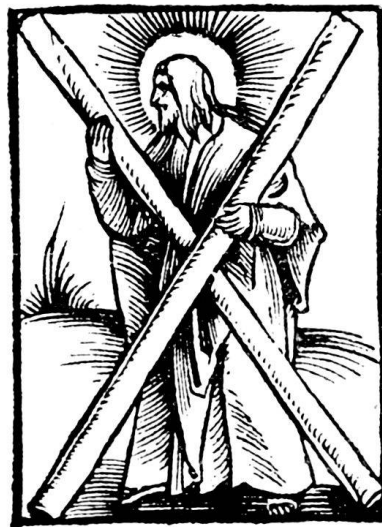
37. Urs Graf. N. 348; br. 0,042; h. 0,0575.

348. Andreas, nach halb l. v., Kopf nach l. Profil. Bei höchst einfachen Mitteln sind Licht und Schatten so kräftig und klar gesondert und in Umriß und Gewandung eine so maßvolle Schönheit entwickelt, daß dies malerisch weiche Blatt für mein Empfinden von keinem anderen Holzschnitt Grafs darin übertroffen wird. br. 0,042, h. 0,0575.