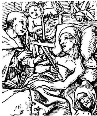
79. Meister D S, aus den zwei Sterbebetten.

von grellestem Licht bestrahlt, und was, je nachdem die Augen, Augenbrauen und die oberen Backenwölbungen parallele Bogen oder Winkel mit einander bilden, zu einem selig blöden oder verhalten schmerzlichen Ausdruck führt 2) . Ersteres in der Abbildungsreihe 77, 78, 79, 80, letzteres in