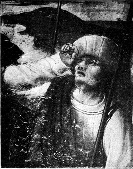
77. Detail des Kreuzigungsbildes in Zürich.

liche Komposition, bei welcher der Frauengruppe links die balgenden Knechte 1) rechts gesondert gegenübergestellt sind, blieb die Mitte allzu