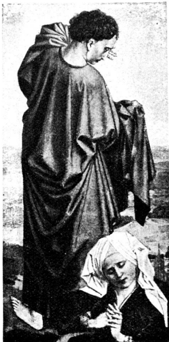
76. Johannes aus der Berliner Kreuzigung des Meisters von Flémalle.