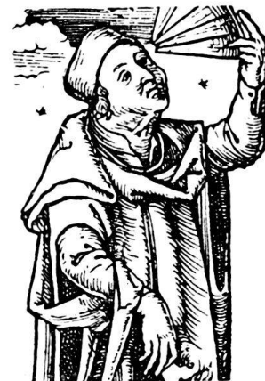
80. Detail des Astronomen des Meisters D S vor 1508.