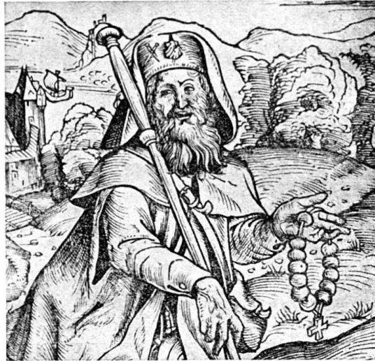
75. Aus dem Pilgerholzschnitt des Meisters D S.