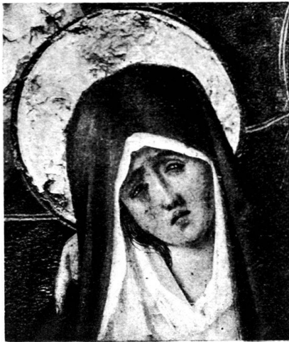
73. Maria des Kreuzigungsbildes in Zürich.

konnte, sich bei dieser einen Entlehnung begnügt und nicht auch die anderen so dankbaren und eigenartigen Gruppen desselben kopiert hätte, andererseits