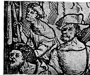
B. um 1505.

83. A. Detail aus dem Tellschuß, B. aus dem Titel von de fide concubinarum .