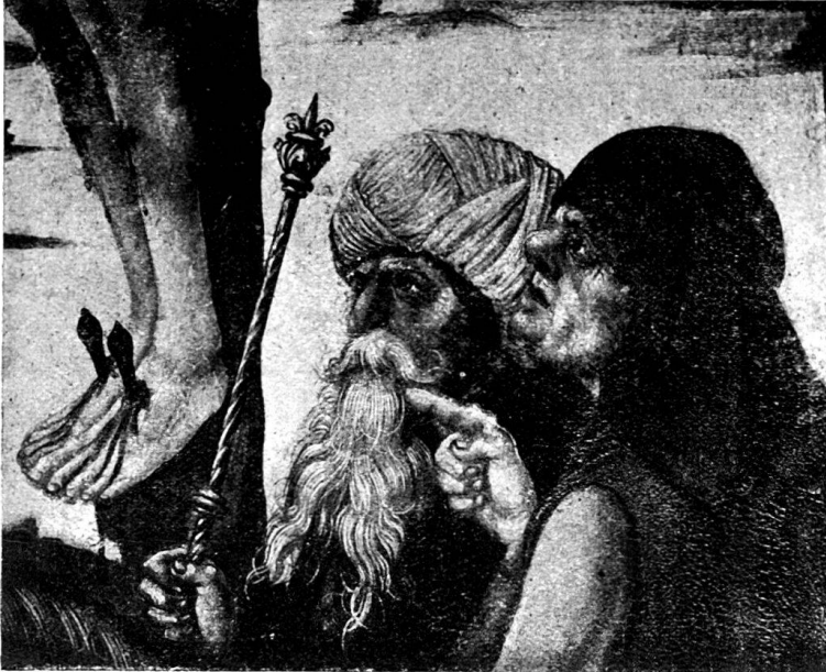
72. Detail aus der Kreuzigung im Schweiz. Landesmuseum.

ger gebildeten Publikum gegenüber nötig hätte; auf der Züricher Kreuzigung herrscht mehr Zurückhaltung, die Natürlichkeit ist nicht weniger sprechend,