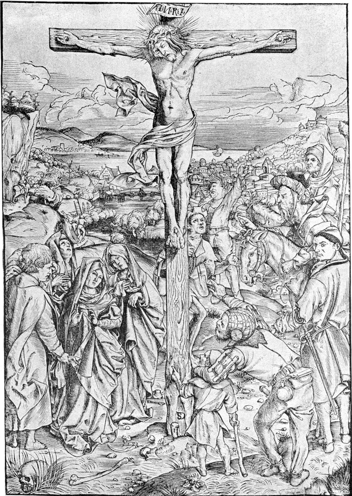
MEISTER D S, KREUZIGUNG DER SAMMLUNG LANNA.

Originalgröße 0,303 br. und 0,431 h. (Nach Lippmann.)