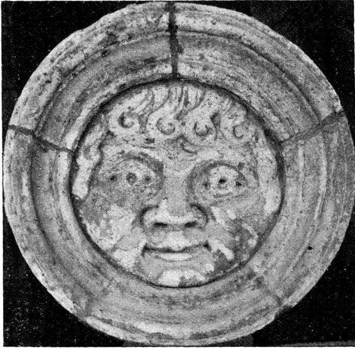
106. Médaillon encastré dans la façade orientale d'une chapelle de croisillon sud du transept de Saint-Pierre à Genève.

comme on l'a prétendu, le dieu tutélaire, le patron de Genève, bien que l'inscription : Deo invicto Genio loci , semble à première vue le faire croire. Le deus est absolument différent du genius , divinité inférieure. L'inscription est une double dédicace. 1) Elle ne prouve qu'une chose, c'est que Mithra était adoré à Genève au troisième siècle. Il n'y a pas lieu d'en tirer aucune conclusion sur l'existence du temple d'Apollon.