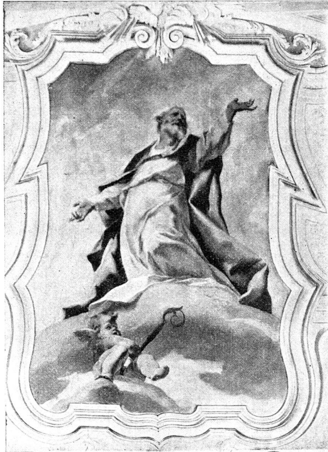
112. Der hl. Sirus. Fresko in der Kirche von Carabbia.

zeichnen. Meiner Überzeugung nach beruht die Inschrift aber doch nicht nur auf einer vermutungsweise, willkürlichen Zuschreibung, und zwar aus dem Grunde, weil die ganz bestimmte Jahreszahl 1728 beigefügt ist. Dieses Datum kann doch nicht ganz aus der Luft gegriffen sein und muß doch auf einer sichern Grundlage beruhen, vielleicht auf einer archivalischen Notiz. Leider ist aber heutigen Tages das Archiv von Sta. Maria degli Angeli teilweise verbrannt, teilweise zerstreut, und das ehemalige Kloster in ein Hotel verbaut. Ich habe mir die größte Mühe gegeben zu erfahren, worauf sich jene Inschrift stützt, habe die ältesten