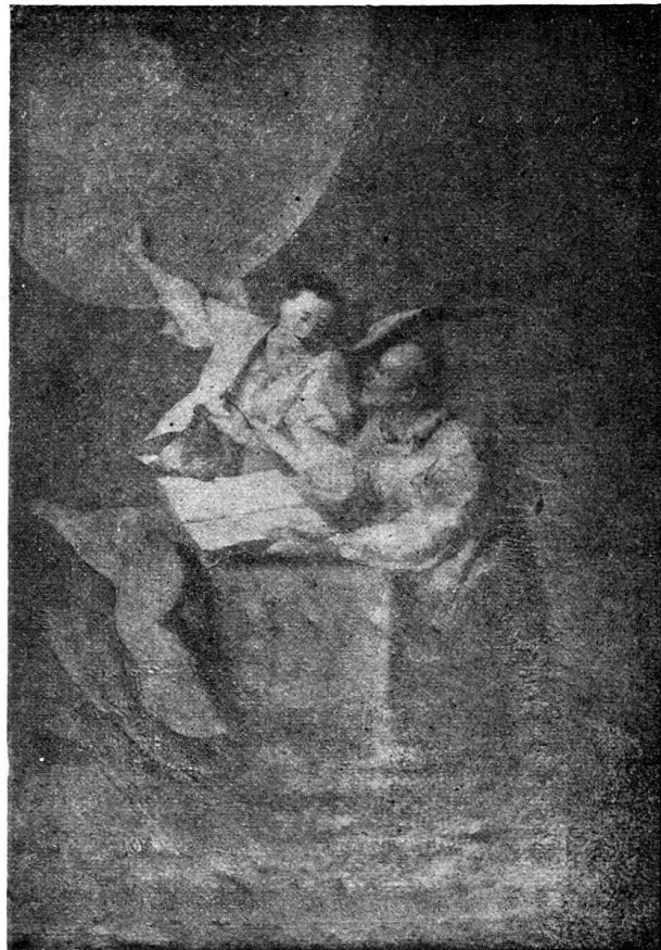
113. Vision des hl. Giovanni de Meda in der Kirche des Collegio Gallio in Como.

sowie in der Gewandbehandlung sind so auffällig, daß kaum ein Zweifel über die Urheberschaft Petrinis obwalten kann. Meisterhaft dem Leben abgelauscht sind auch die ältlichen Gesichtszüge der hl. Anna; es ist wie ein Porträt; diesen Typus kann man bei italienischen Frauen noch heutigen Tages häufig finden. Die ganze Gruppe scheint zu leben; reizend ist der Eifer, mit dem die kleine Maria sich ihrem Pensum widmet, zum Ausdruck gebracht, wie sie mit dem Finger aufzeigt, gespannte