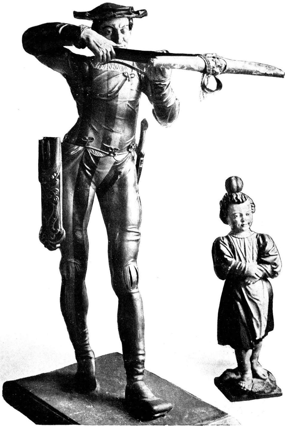
TELL UND SEIN KNABE.