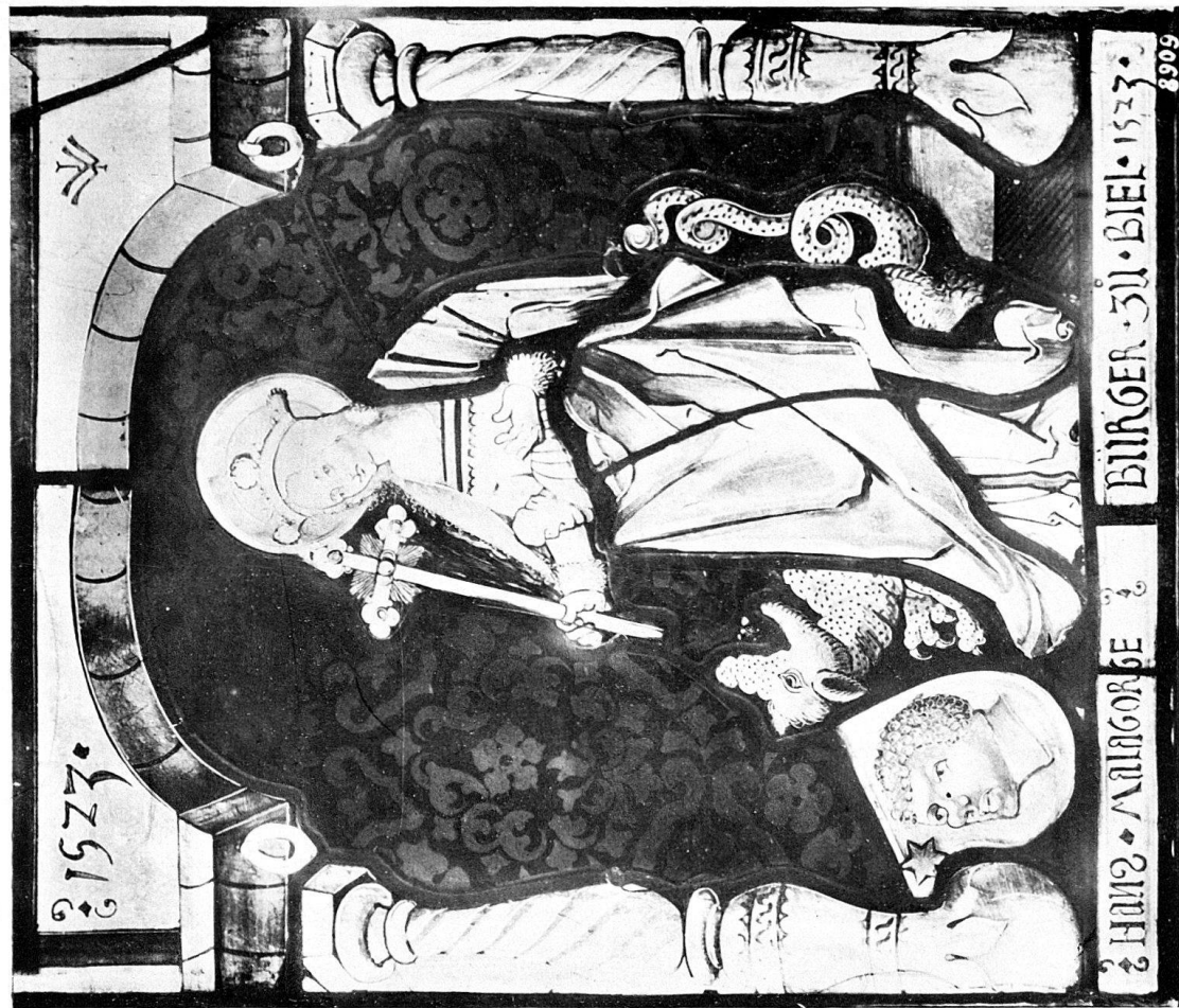
WAPPENSCHIEBE DES HANS MALAGORGE, BÜRGER ZU BIEL, 1529.

ARBEITEN DES GLÄSMALERS JAKOB WILDERMUT ZU NEUENBURG IN DER KIRCHE VON LIGERZ.