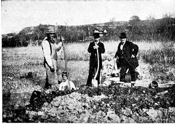
Abb. 5. Ausgrabung in der Pfahlbaustation Sutz durch Dr. V. Groß u. Dr. E. v. Fellenberg.

Im Winter 1881/82 wurde von Besitzern der Strandböden bei Vinelz eine Wasserlache gegen den See abgeleitet. Die Arbeiter, die zu diesem Zwecke einen Graben gegen den See erstellten, stießen bei ihrer Arbeit auf Pfähle und eine schwärzliche Schicht.