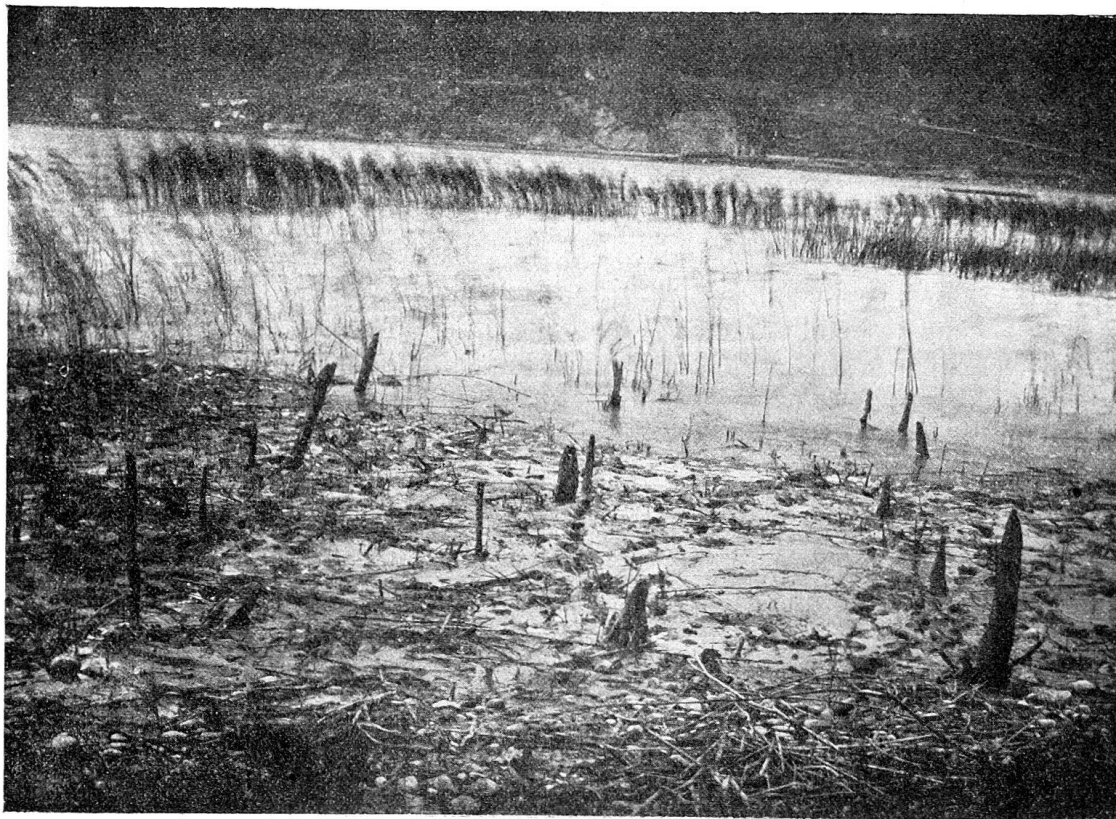
Abb. 6. Ueberreste eines freistehenden Pfahlbauhauses (Bielersee).

Es sei noch einer besondern Art von Funden, den Einbäumen eine kurze Betrachtung gewidmet. Als „Heidenschiffe“ waren sie den Fischern wie die Pfahlbauten schon seit den ältesten Zeiten bekannt. Den ersten Einbaum hat wohl Notar Emanuel Müller in Nidau zu heben versucht, der, wie wir vernommen haben, in Stücke ging. Solche Schiffe wurden im Anfang der Erforschung von vielen Stationen gemeldet. Bei Mörigen sollen