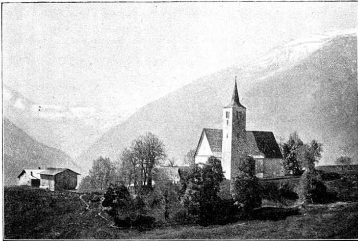
Abb. 1. Die Kirche von Pleif.

Einer der schönsten Punkte im sonnigen Lugnetz ist wohl die Terrasse von Pleif. Natur und Kunst und Geschichte haben sich dort verbündet und ziehen den Wanderer hin zur eschenumrauschten Talkirche (Abb. 1 und 2).