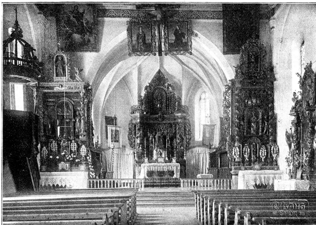
Abb. 4. Kirche von Pleif. Inneres.

Umfassendere Veränderungen brachte das Jahr 1661, dessen Zahl jetzt noch ob dem Hauptportal prangt. Damals wurde das Schiff gründlich umgebaut (Abb. 4). In wie weit man die Mauern stehen ließ, läßt sich augenblicklich nicht entscheiden. Wurden sie nicht zum Teil abgebrochen, so müssen sich rechts