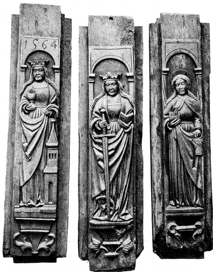
Abb. 3. Reliefschnitzereien des 16. Jahrhunderts aus Schwyz, hl. Patroninnen darstellend; Barbara gegen die Fieberkrankheiten, Katharina gegen den plötzlichen Tod, Verena als Beschützerin der Müller.

Sicherheit bestimmbarer Gebäulichkeiten. Sie messen durchschnittlich 1 m bis 1,50 m in der Höhe und sind in Eichenholz geschnitten. Schon der kräftigen typischen Schnitzereitechnik halber verdienen diese für die Geschichte der ländlichen Gotik nicht uninteressanten Arbeiten der Vergessenheit entrissen zu werden, selbst wenn der Name des Bildhauers uns nicht überliefert worden ist. Leider kann der Zustand ihrer Erhaltung nur ein leidlich guter genannt werden, das Relief wurde vielfach arg mitgenommen. Wie weit sich der Künstler in der Ausführung seiner Arbeit an bestimmte Vorlagen hielt, läßt sich heute ebenfalls nicht mehr feststellen. Manche seiner Bilder erinnern an die