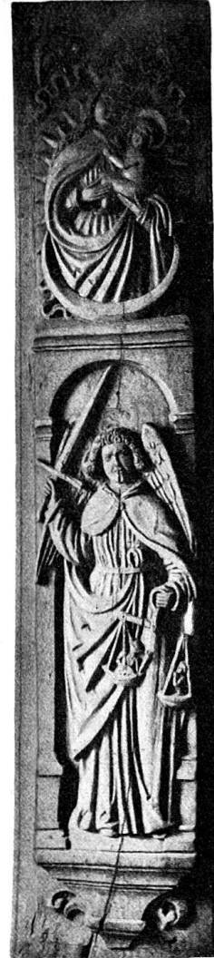
Abb. 4. St. Michael als Patron der armen Seelen.

So bildete die Vorliebe für geschnitzten Zimmerschmuck in einem gewissen Sinne die würdige Ergänzung zu der in Schwyz gleichzeitig blühenden Sitte des Wappenscheibenschmuckes. Bei beiden Künsten handelt es sich darum, in beschränktem bescheidenem Raume stilvolle Effekte zu erzielen. War es der zeichnerischen Hand verhältnismäßig leicht, ihre Kunstabsicht dem Glase anzuvertrauen, so gestaltete sich das Problem um so schwieriger für den Bildschnitzer, seine schwere Hand vermochte, wie unsere Bildschnitzereien deutlich zeigen, der Schwesterkunst nicht standzuhalten.