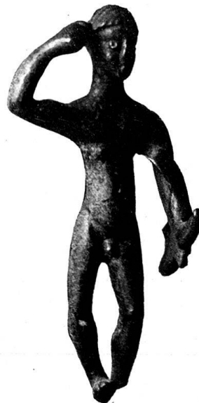
n o 4.

N o 1—10. Hercule brandissant la massue du bras droit; la main gauche tient l'arc, et la peau de lion, parfois omise (n o 8—10), repose sur le bras gauche.