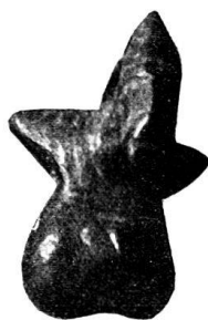
n o 23.