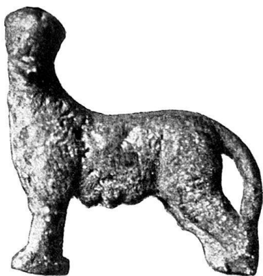
n o 22.

M. van Gennep, professeur d'ethnographie à l'Université de Neuchâtel, a attiré mon attention sur la ressemblance que