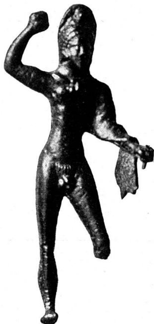
n o 2.