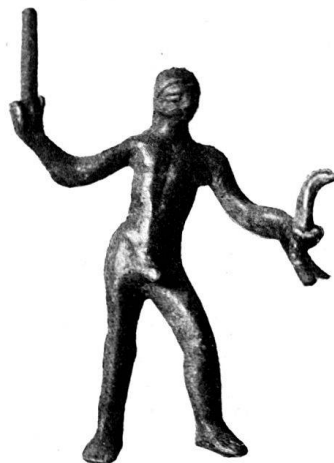
n o 3.