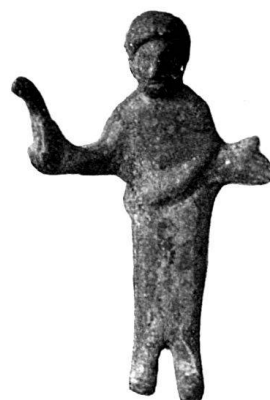
n o 15.