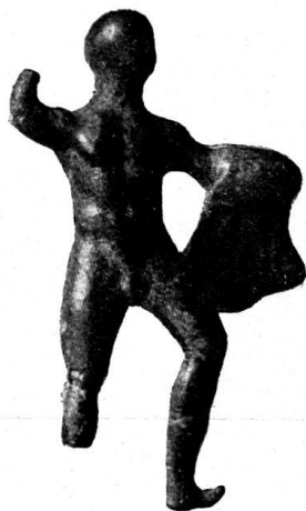
n o 5.