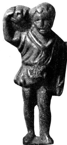
n o 17.