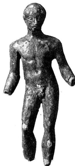
n o 16.