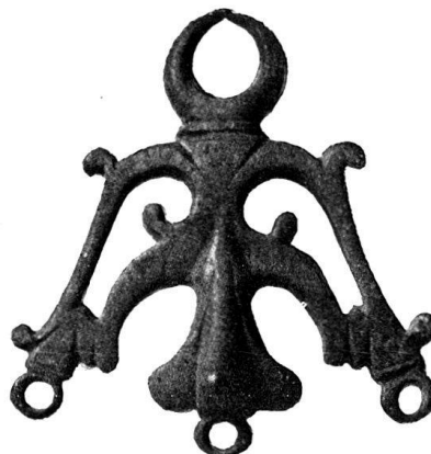
n o 24

montre ce bronze avec une série d'amulettes, encore en usage à Naples, mais dont le type remonte à l'antiquité; elles représentent la branche de rue, plante dont le pouvoir magique est connu 1) , à laquelle sont attachés divers autres objets ayant même puissance, entre autres, comme ici, le croissant lunaire 2) . Il est vraisemblable de penser que l'amulette de Neuchâtel appartient à cette curieuse série.