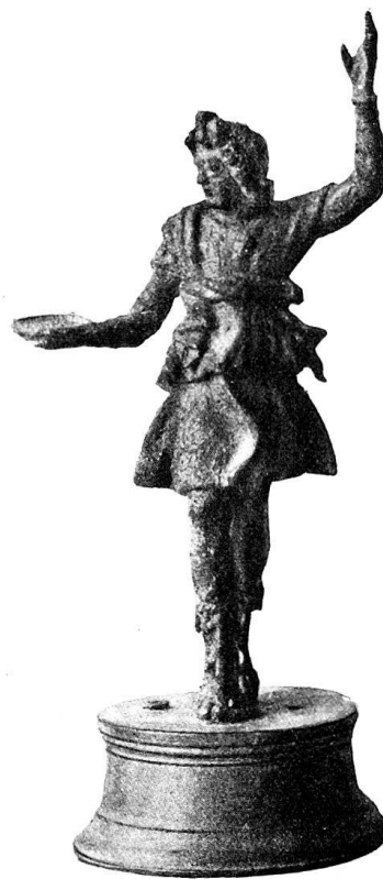
n o 14. Lare de Muri (p. 30).