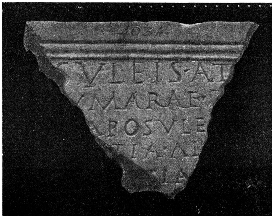
Abb. 2. Bruchstück einer Inschrift für die Suleviae aus Avenches.