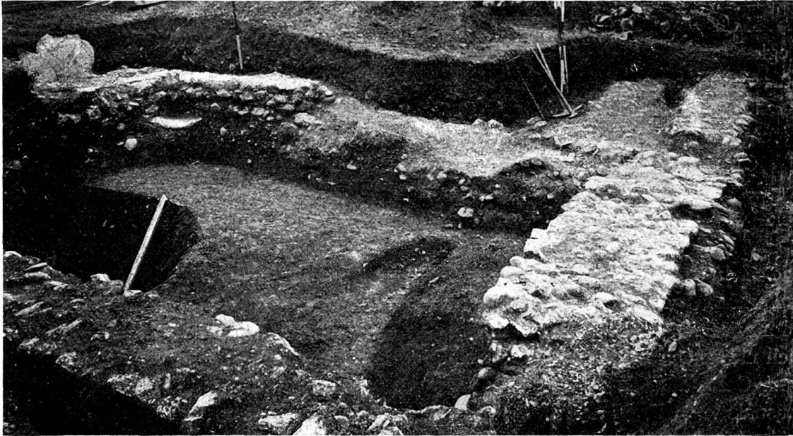
Abb. 5. Ein Bau auf dem Schürhof.

Unsere Arbeit, die mit der Zudeckung vom 16. September bis 1. Oktober dauerte, ergab einen von starken Mauern gebildeten viereckigen Bau, der sich nach Nordosten fortsetzt. Weil jedoch die Fortsetzung die Landgrenze überschritt, konnten wir nicht alle Mauerreste verfolgen.