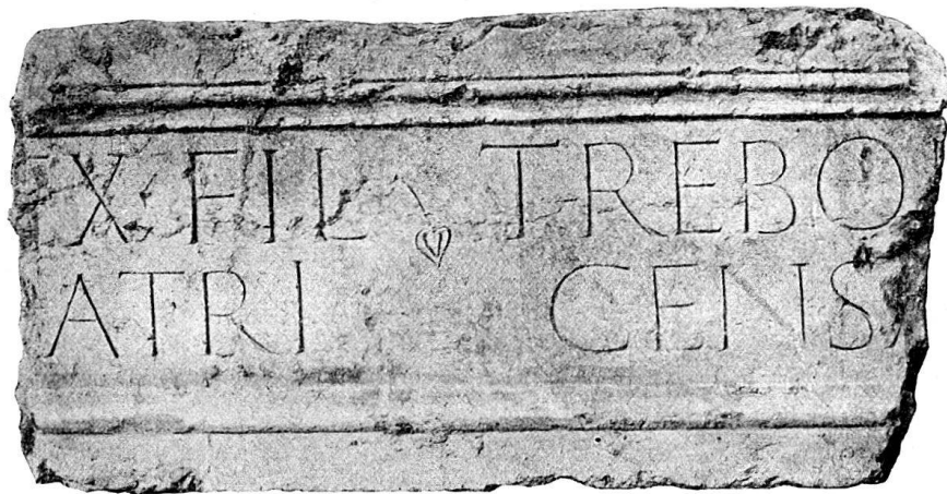
Abb. 1. Architrav mit Inschrift aus dem Quartier de la Madeleine in Genf.

sur l'emplacement de la Madeleine-Longemalle à Genève“ im Bulletin de l'Institut national genevois T. XLI (1913). Letztere Arbeit liegt mir als Sonderabdruck (27 S. 8 o ) vor, dessen Zusendung ich dem Verfasser verdanke. Außer prähistorischen und gallischen, aber auch mittelalterlichen Fundstücken sind besonders zahlreich die römischen. Unter diesen befindet sich das Bruckstück eines Architravs mit Inschrift aus gelblichweißem Jurakalk, links und rechts gebrochen, 1,21 m lang, 0,62 m hoch, 0,47 m dick. Der Stein wurde am 23. März 1910 in einer Kellermauer eines der niedergelegten alten Häuser eingemauert gefunden mit der Schriftfläche nach innen. Über die Fundstelle schreibt mir Herr Reber: „der Stein der Maja (s. oben) wurde während den nämlichen Grabungen, direkt neben der Kirche, wahrscheinlich in dem von mir signalisierten römischen