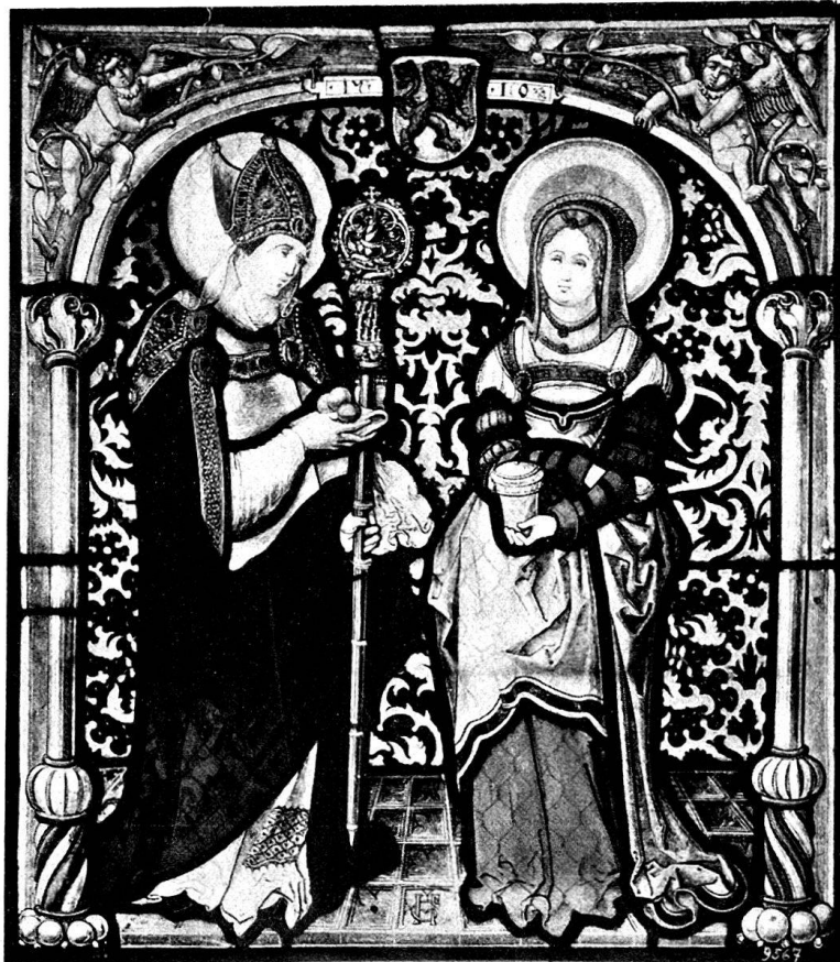
Abb. 1. Figurenscheibe mit Wappen der Stadt Bremgarten. Hist. Museum in Bern.

Das zweite Glasgemälde aus dem Jahre 1510 schmückt heute noch ein Fenster in der Kirche des großen bernischen Dorfes Melchnau , das hart an der Grenze gegen den Kanton Luzern liegt. Es stellt den Papst Urban dar, welcher, geschmückt mit der Tiara, in der Rechten einen Stab mit einem kostbaren dreifachen Kreuz, in der Linken eine Traube hält. Die Figur ist demnach eine Kombination des Papstes Urban (222 bis 230), der sonst mit einem Schwerte dargestellt wird, mit dem Bischof Urban von Langres, der sich nach der Legende vor seinen Verfolgern hinter einem Weinstock verbarg, nachher Patron der Weingärtner in Frankreich wurde und infolge dessen gewöhnlich mit einer Traube in der Hand abgebildet wird. Der Heilige trägt über der Dalmatika ein faltenreiches Pluviale mit reich gestickter Kappa, die bis über die Schul-