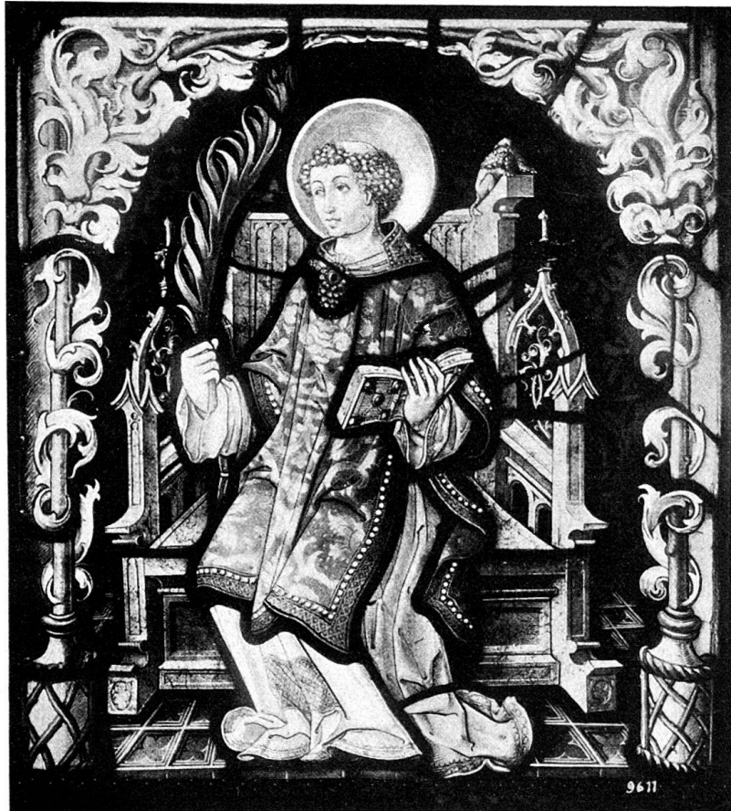
Abb. 2. Figurenscheibe, darstellend St. Vinzenz. Bern, Privatbesitz.

Ein kleineres und einfacheres Gegenstück zu diesem Glasgemälde bildet eine zweite Darstellung des hl. Vinzenz im Schweizerischen Landesmuseum