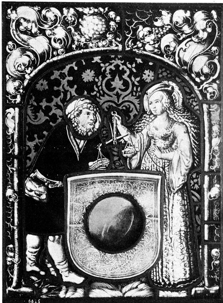
Abb. 4. Wappenscheibe mit unbekanntem Wappen. Schweiz. Landesmuseum.

burg, einen alten, reichen Mann in Lederstiefeln vor, der einen pelzverbrämten roten Rock und eine große Geldtasche am Gürtel trägt. Er stützt sich auf den Schild. Diesem gegenüber steht eine vornehm gekleidete Dame,