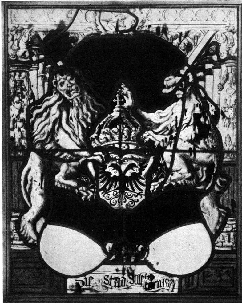
Abb. 3. Standesscheibe von Solothurn in der Kirche zu Arch.