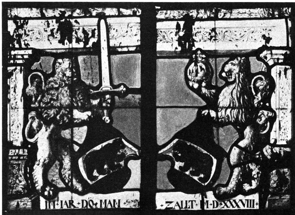
Abb. 2. Standesscheiben von Bern in der Kirche zu Arch.