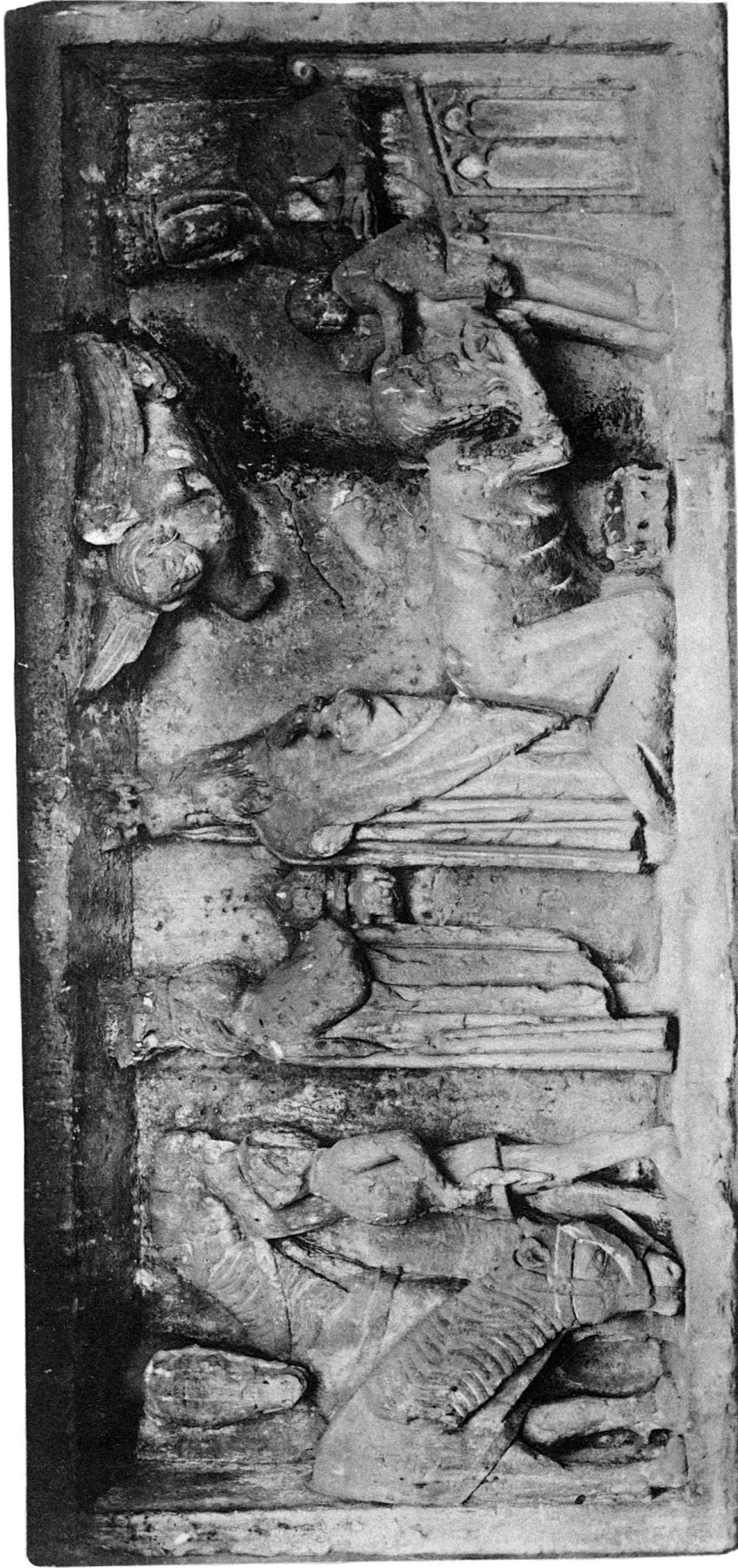
Antependium des Dreikönigsaltars aus dem Basler Münster.