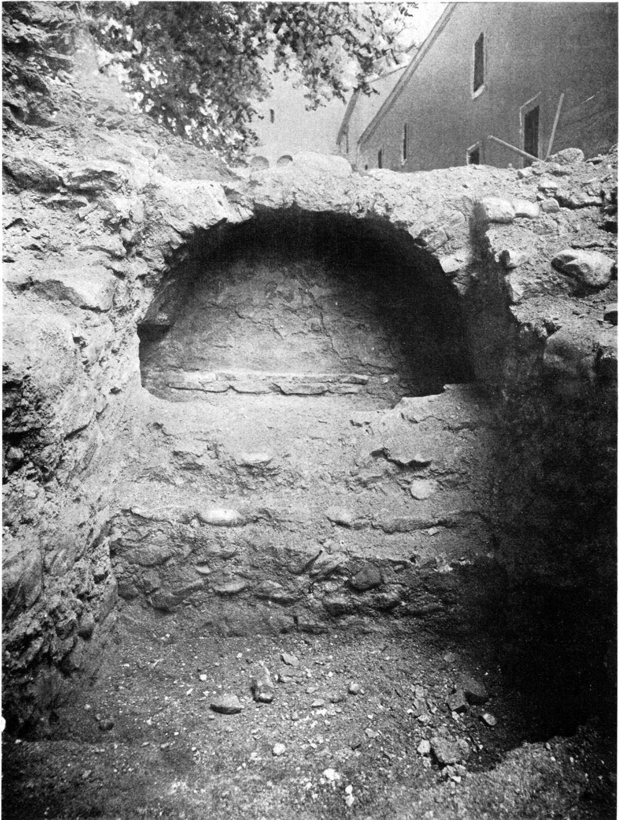
Le Martyrium ou Confessio , le tombeau de St-Maurice avec arcosolium , IV e siècle.