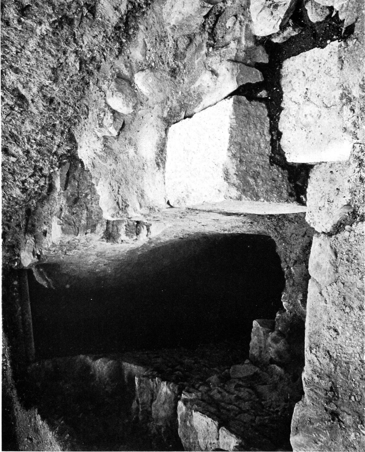
L'entrée du Martyrium , de la crypte de St-Maurice, IV e siècle.