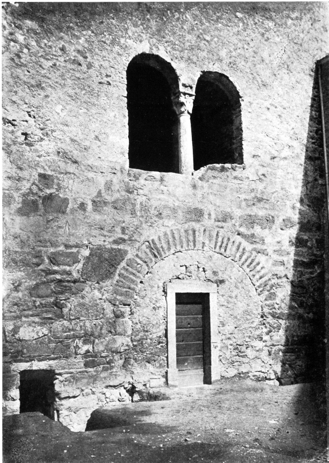
Premières fouilles vers la tour, en 1896.