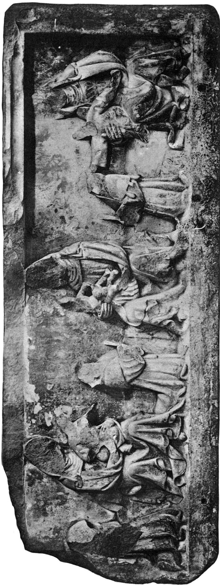
Antependium des S. Annenaltars aus dem Basler Münster.