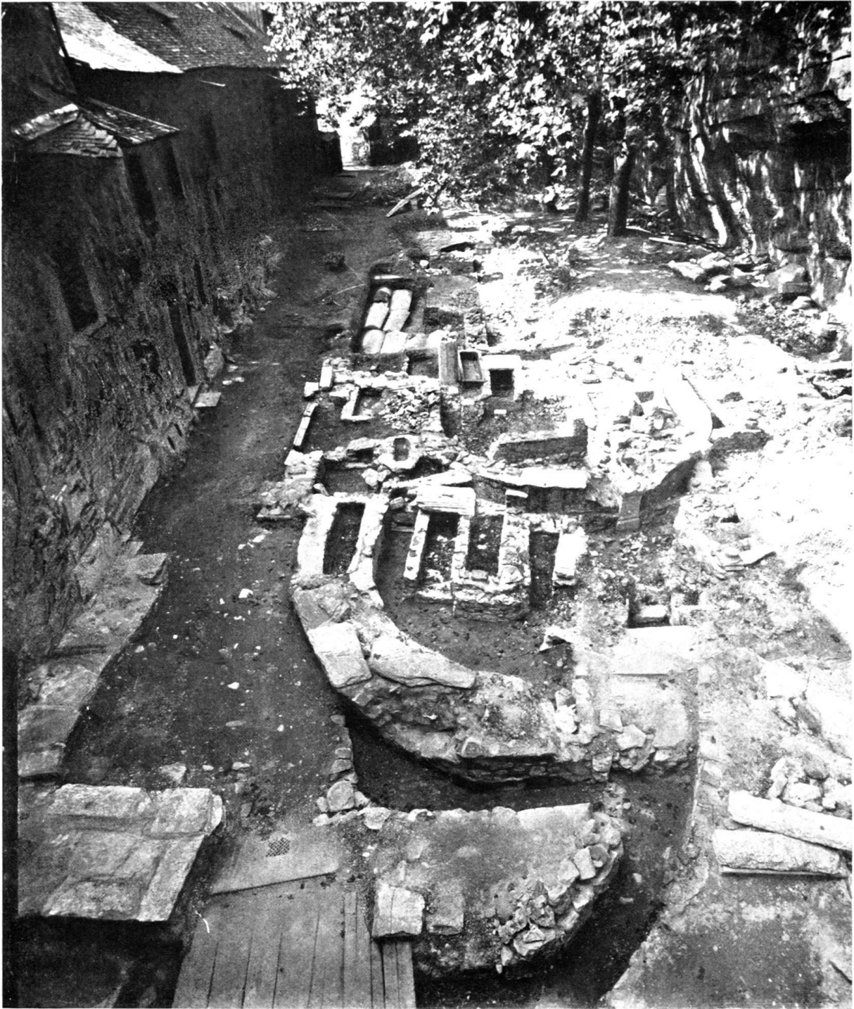
Vue générale des fouilles de St-Maurice, sur l'emplacement des anciennes basiliques.