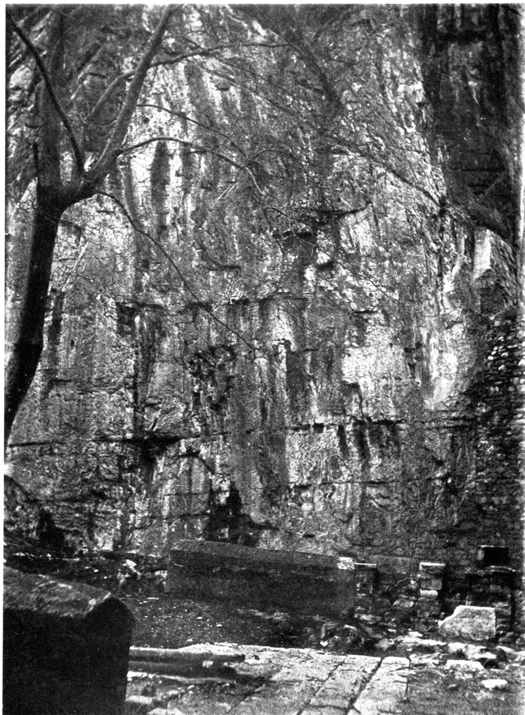
Emplacement des basiliques du IV e et du VI e siècle, adossées au rocher. Rainures du toit et entailles des poutres équarries, des entrails de la charpente apparente.