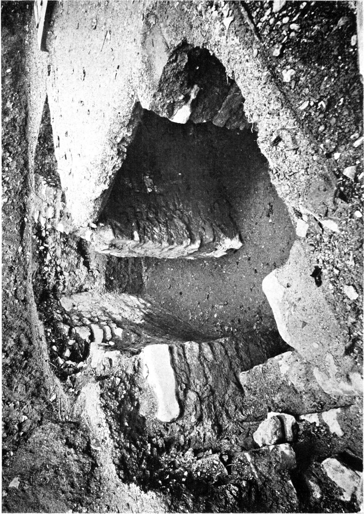
Le couloir en hémicycle et l'entrée de la Confessio, du Martyrium de St-Maurice.