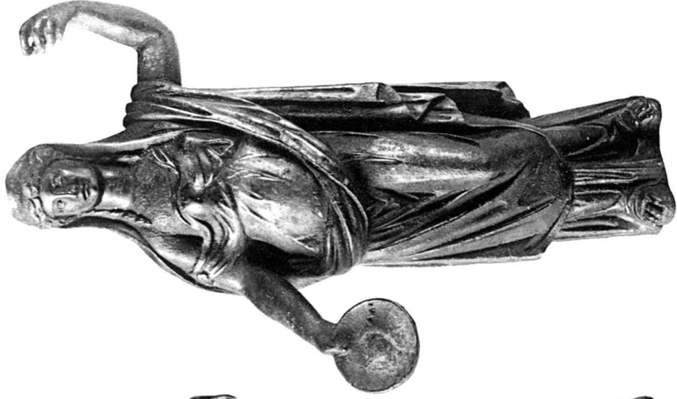
1. Junon (Avenches)