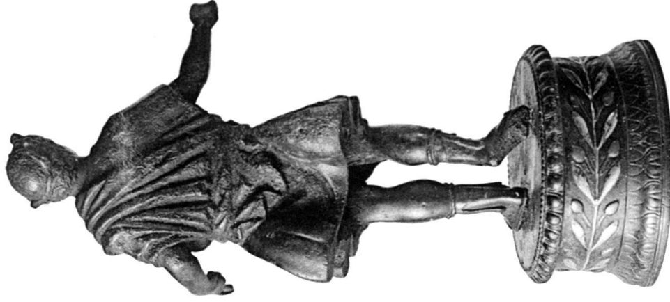
3. Dieu Lare (Avenches)