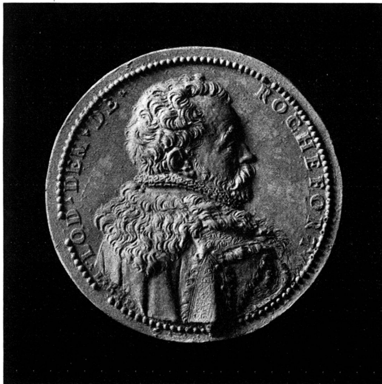
Abb. 3. Blei - Basel.

Auch von dieser Medaille, die nach meiner Ansicht die künstlerisch schönste