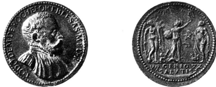
Abb. 1. Bronze - Florenz.

Rückseite: drei stehende, bekleidete Frauen in Kontrapoststellung, zur Sonne aufblickend. In der Mitte die Siegesgöttin mit griechischem Helm, einen Globus mit Sternen in der Rechten haltend und mit der andern Hand eine Victoria mit Kranz hochhebend, zu Füßen ein liegender nackter Knabe, der einen Bogen emporreicht. Zur Linken ein Genius der Fruchtbarkeit und des Handels mit Flügeln, den rechten Fuß auf die Weltkugel gesetzt, mit gesenktem Steueruder in der Rechten, mit Füllhorn und Ähren in der Linken. Zur Rechten die