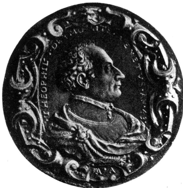
Abb. 8. Blei - Basel.