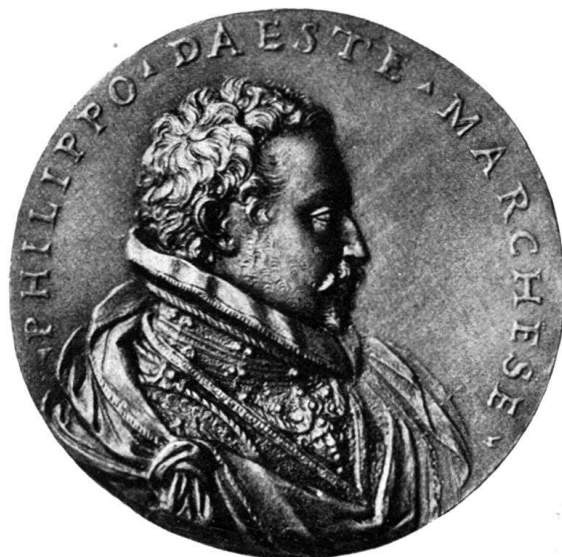
Abb. 6. Blei - Basel.

Es scheint mir nicht ohne Interesse, unser Exemplar hier abzubilden, da es so scharf und unberührt aussieht, als wäre es eben erst nach dem Wachsmo- dell gegossen. Ich glaube es sicher auch dem Alessandro Ardeni zuschreiben zu dürfen. Besonders mit der Coligny-Medaille weist die Este-Medaille große Verwandtschaft auf. Man vergleiche, wie der Körper bei beiden