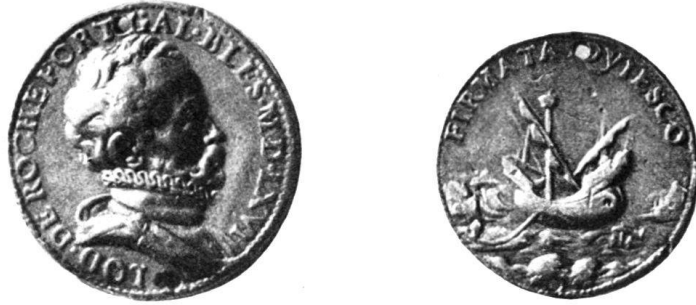
Abb. 2. Bronze - Florenz.