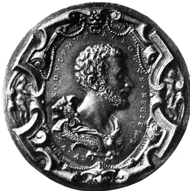
Abb. 7. Blei - Basel.

Büste im Profil nach rechts, barhaupt, mit freiem Hals, mit durch Agraffe gehaltener Schulterdraperie, mit ornamentiertem Abschluß von Delphinen. „RODVLPHVS . ARLOTVS . REGIENS . A. A.“ auf hochovalen Grund, von reichem Rollwerk umgeben, das links durch eine nackte Frau, rechts durch ein nacktes Kind, oben und unten durch Masken und Perlschnüre verziert ist.