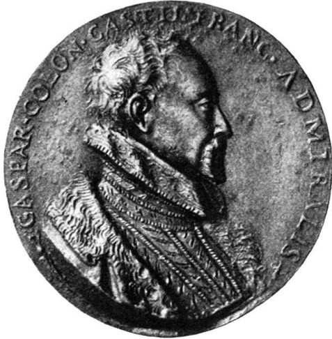
Abb. 4. Blei - Basel.

medaillen in Silber, 28 Renaissancemedaillen in Bronze, 95 meist einseitige Renaissancemedaillen in Blei von Rochefort nach Basel gebracht und im Jahre 1576 durch Basilius Amerbach erworben wurden. Aus einem Briefe Amerbachs an Occo geht ferner hervor, daß er etwa 100 Kronen dafür bezahlt hat 26) . Es finden sich unter diesen Münzen und Medaillen, die in unserer Sammlung zu identifizieren sind, da Amerbach meist die genaue Legende aufzeichnete, ganz prächtige und seltene Stücke. Hier sollen nur einige wenige Bleimedailles be-