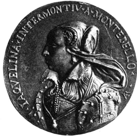
Abb. 5. Blei - Basel.

sprochen und wiedergegeben werden, die, soviel mir festzustellen möglich war, unrichtig bestimmt, äußerst selten oder unediert sind.