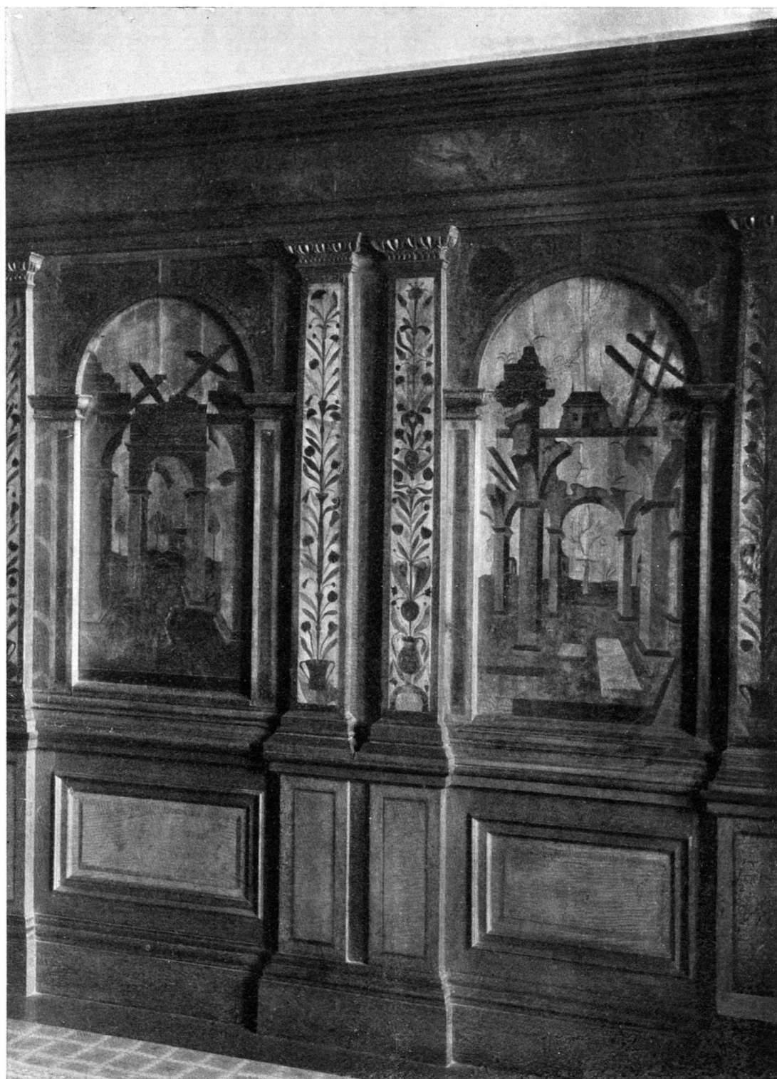
INTARSOGETÄFER AUS DEM BLÄSERHOF IN KLEIN-BASEL.