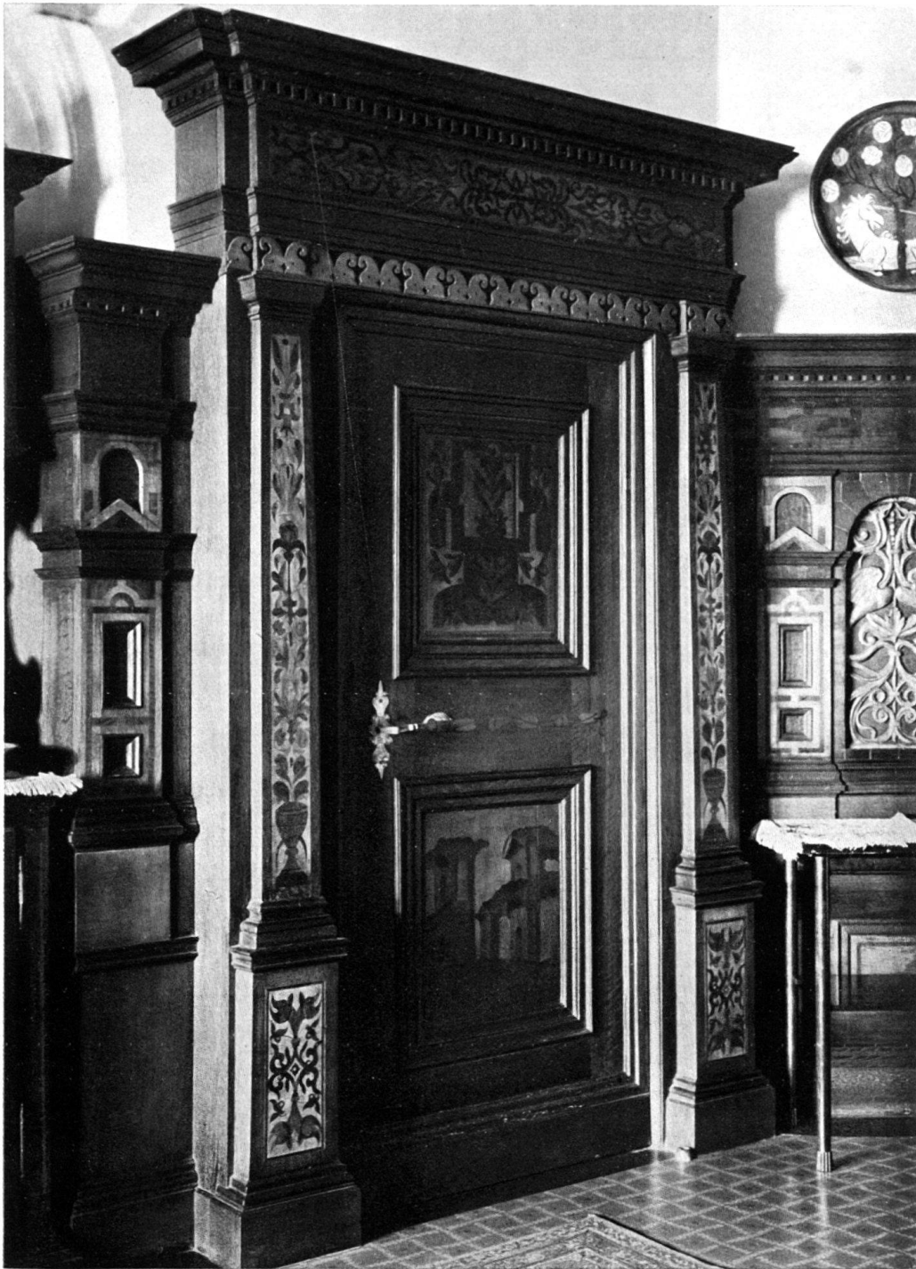
INTARSOTÜRE AUS DEM BLÄSERHOF IN KLEIN-BASEL.