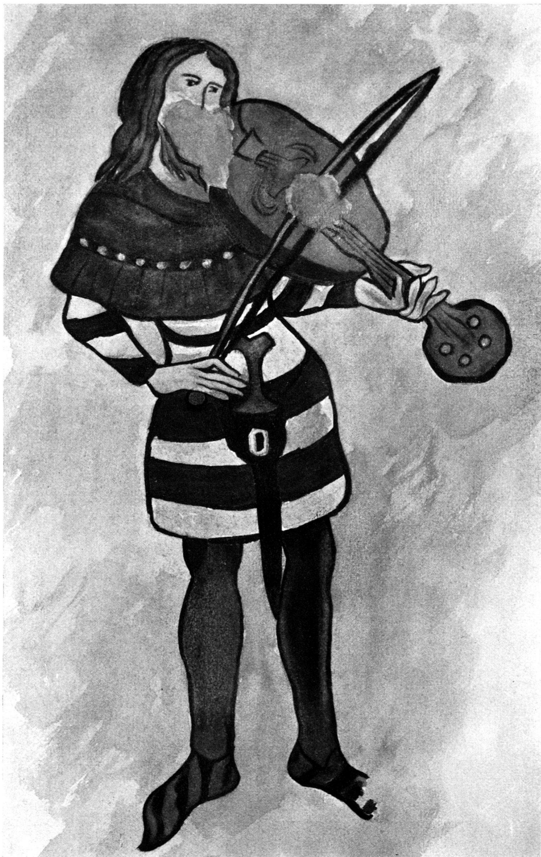
Fries im Hause „Zum Grundstein“ in Winterthur (Detail) um 1300. Original zerstört.

(Nach einer genauen Pause im Besitz der antiquarischen Gesellschaft Zürich.)